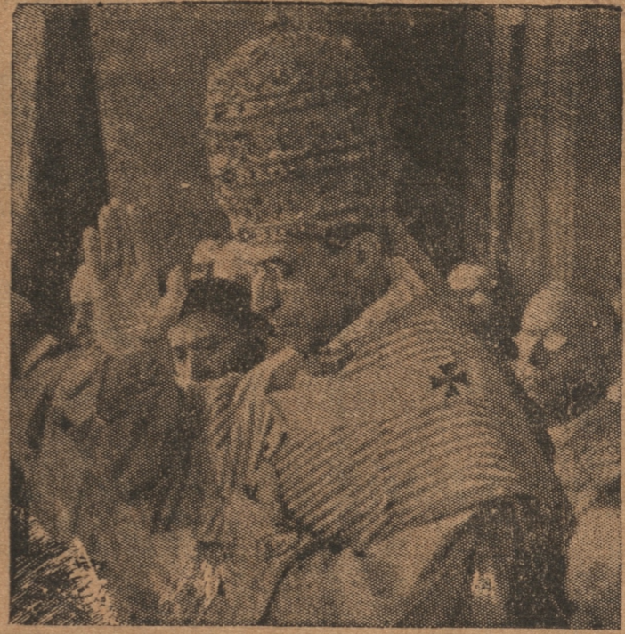
S. S. el Papa Pio XII que ayer visitó al Rey de Italia Víctor Manuel III, en el Palacio del Quirinal. Se atribuye a esta visita una excepcional importancia.

ROMA, 28. (U. P.) — Al saludar al Papa el Rey quiso arrodillarse; Su Santidad como señal de estimación le tendió la mano e impidió que el monarca se arrodillara. Haciendo un gesto similar, el Papa también retiró la mano cuando Víctor Manuel quiso besar el anillo del Pescador, del Pontífice, la Reina, el príncipe heredero y todos los demás miembros de la Casa Real se arrodillaron y besaron la mano del Papa. ROMA, 28. (U. P.) — En el Palacio del Quirinal el Papa Pio XII y el Rey Víctor Manuel III, se encontraron esta mañana en tierra italiana, siendo ésta la primera vez en la historia que un Rey de Italia y un Papa se reúnen en Italia. También es la primera vez que un Papa, desde Pio Nono, ha entrado al Quirinal. Al entrar al patio de honor del Quirinal, a las 10.30 A. M., en carruaje abierto, pasó S. S. revista a las tropas que le rendían honores, en tanto que una banda militar tocaba los himnos Pánel y la Giovinetta. DISCURSO DE SU SANTIDAD ROMA, 28. (U. P.) — El Papa pronunció un discurso en el Quirinal, pidiendo la paz. "Que Italia sea fuerte y grande, dijo,