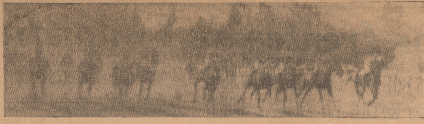
Partida del premio Mauser. Don Federico, como de costumbre, se luce al dar esta magistral partida.

Ancía, 54. En Talcahuano biaremos. Levantiso, 53. Bonito animal. Ojo al Charqui, 53. Cuando le den descanso, después ha Refinada, 53. No la conoc-