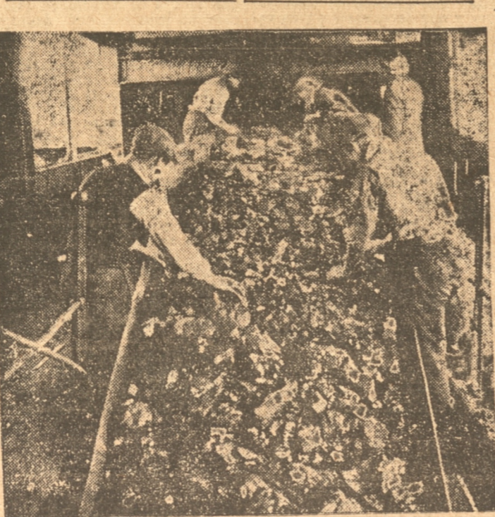
En transportadores seguros el carbón va a diversas distribuciones: observese el buen estado del vestuario de los obreros.