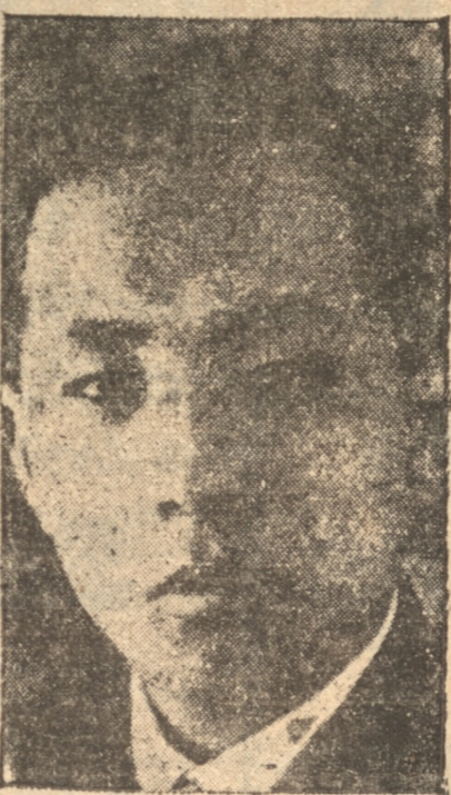
MARISCAL CHANG SUEH LIANG, gobernador de Manchuria

PEIPING, 9. — (UP). — Comunican de Tientsin que la ciudad amaneció tranquila hoy lunes, los desordenes de anoche han obligado a los aterrizados habitantes chinos a refugiarse en el barrio de los extranjeros. La Legación de Japón informa que los amotinados de Tientsin eran soldados manchurianos revedes, quienes disparaban a diestra y siniestra; mataron a dos centinelas y una mujer.