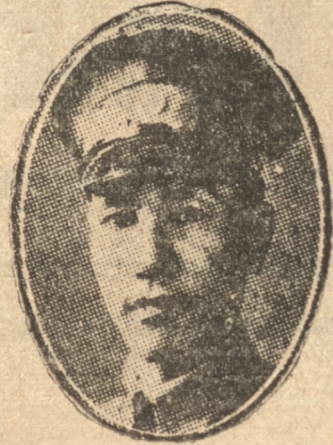
General CHIANG KAY SHEK, jefe del Gobierno nacionalista de Nanking

CON ESTE SUCESO, LA SITUACION EN MANCHURIA SE AGRAVARIA ENORMEMENTE. — MOVIMIENTOS DE TROPAS CHINAS CERCA DE TSITSIHAR. — JAPON DA SEGURIDADES QUE NO SE AGRAVARA LA SITUACION. — ESTADOS UNIDOS ESTUDIARIA UN NUEVO METODO PARA MANTENER LA PAZ EN EL LEJANO ORIENTE. — LOS JAPONESES INSTIGARIAN A LOS RUSOS BLANCOS PARA INTERVENIR. — OTRAS INFORMACIONES