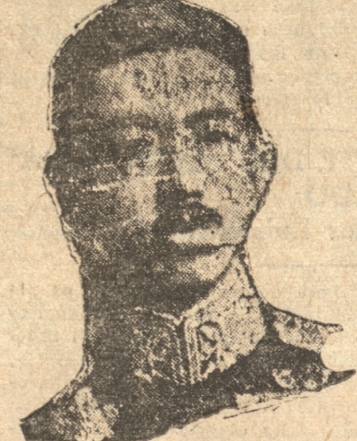
HIPOHITO, Emperador de Japón

GINEBRA, 9. — Los círculos de la Liga de las Naciones declaran que la exigencia japonesa de un acuerdo escrito sobre sus famosos cinco puntos antes de retirar sus fuerzas de la Manchuria es una nueva evidencia de que no tiene allí sus tropas para defender a sus nacionales, sino para obligar a los chinos a hacer concesiones, lo cual coloca a los nipones en situación de violadores del Convenio de la Liga de las Naciones. La opinión del Secretario General de la Liga, Sir Eric Brummond, con respecto al valor de las afirmaciones chinas y japonesas es que ellas son inmatutales, ya que no hay un poder votante, sino que meramente uno que trasmite los documentos a los miembros del Consejo.