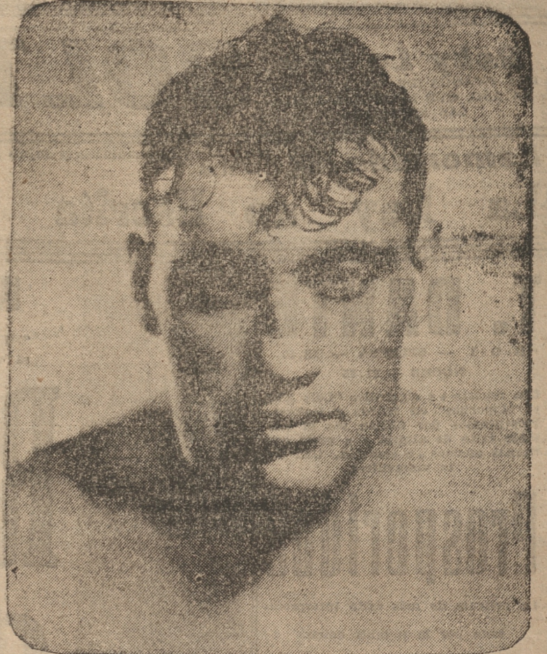
PRIMO CARNERA, actual campeón mundial de box, peso pesado.