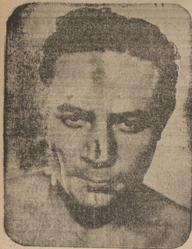
MAX BAER, challenger al cetro del mundo de gran peso.

Se confía en que Carnera seguirá siendo el rey de los peso máximo. — Declaraciones que ha hecho cada uno de los pugilistas. — Breve estudio de cada hombre. — Otros datos de interés