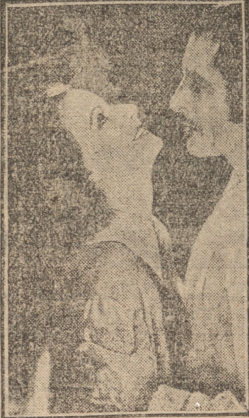
Es la pasional historia de aquella reina, cuyo cora- zón supo amar, como nunca amó mujer alguna, y que por seguir al hombre amado abandonó su trono y su pueblo.

NOTA.- Sólo se venderán 200 galerías en tard y 200 galerías en noche.