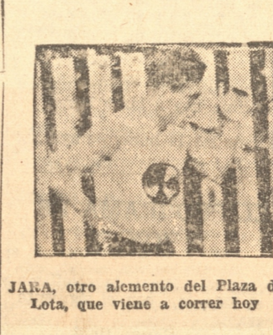
JARA, otro elemento del Plaza de Lota, que viene a correr hoy

la carrera del Quintuple Circuito del Parque Ecuador.