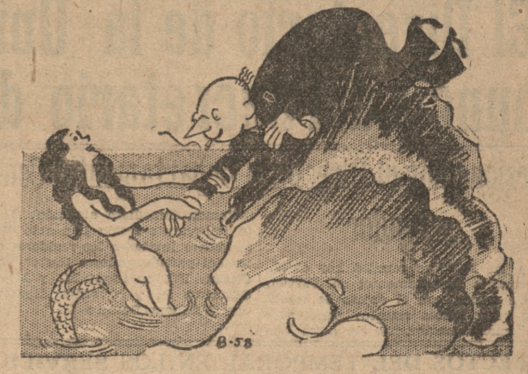
(De "El Romancero de Pipo")

Hace un mes atrás se tomó declaración a varios suboficiales de carabineros nudiendo conocerse la verdad de lo ocurrido.