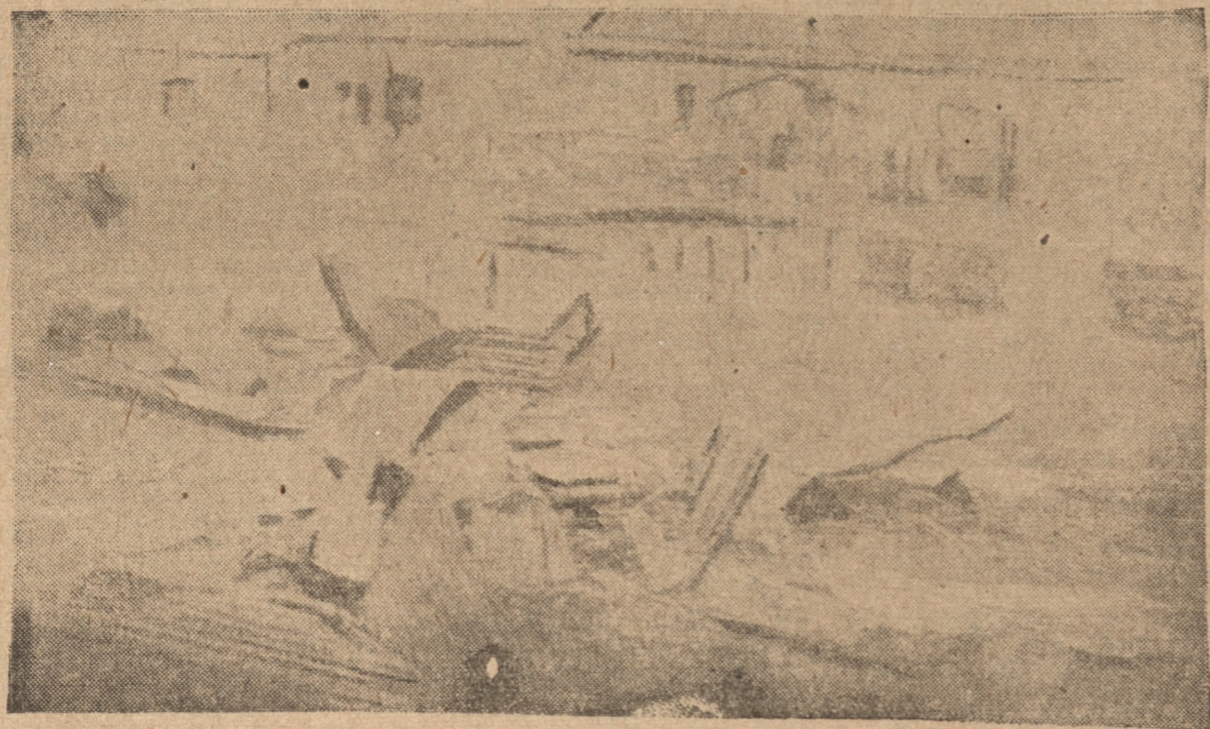
ASPECTO DE LOS ESCOMBROS DESPUÉS DEL INCENDIO DE SAN VICENTE

Hubo escenas de verdadero pavor, y cuadros indescriptibles, pues entre las piezas invadidas completamente por el humo se perdían a buscar desesperadamente entre las llamas. Felizmente no ocurrió ninguna desgracia personal lamentable a pesar de las