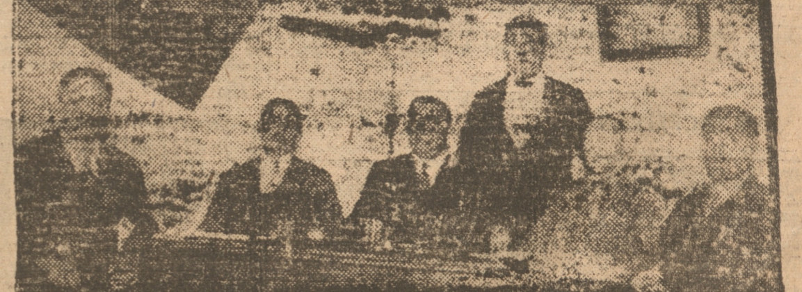
JUNTA DIRECTIVA DE LA CONVENCION DE COMERCIANTES MINORISTAS QUE INICIO AYER SUS LABORES