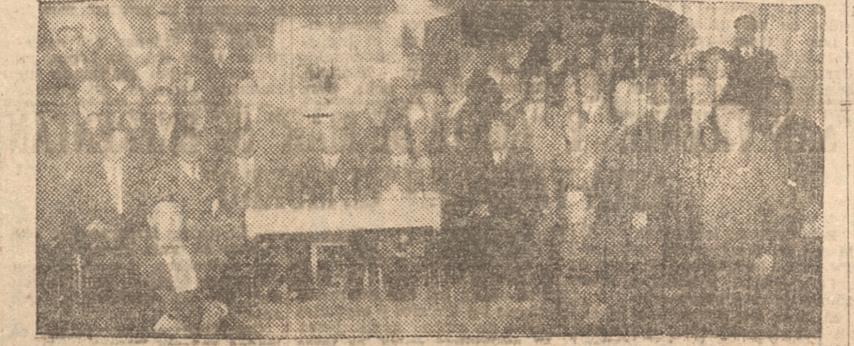
GRUPO GENERAL DE DELEGADOS ASISTENTES A LA CONVENCION