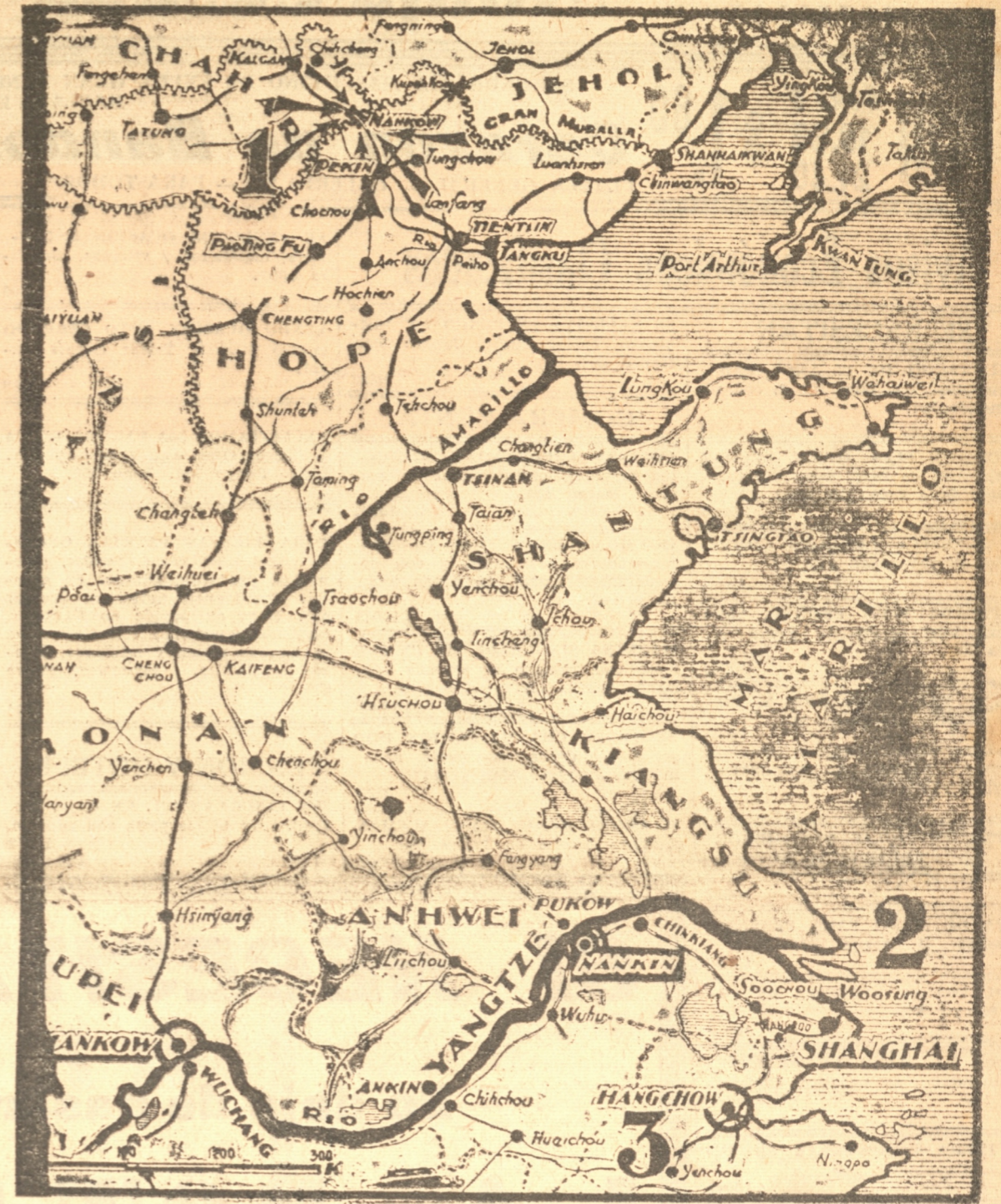
No 1: Indica las zonas inmediatas al paso y defiladero de Nan kov. — No 2: Parte grisada; comprende la región de Shanghai, donde se ha concentrado la principal acción bélica de ambos combatientes. — No 3: Puerto y ciudad de Hangchow, donde los japoneses efectúan grandes desembarcos de tropas

LONDRES, 3.— (UP).— El corresponsal de "The Exchange Telegraph Co." en Hong Kong informa que el crucero "Suffolk" entró al dique a hacerse reparaciones después de ser choacado ayer por un barco de carga chino a consecuencia del tifón. — HONG KONG, 3.— (UP).— El total de las víctimas habidas por el tifón se calcula en un centenar. Todos los muertos eran chinos, con excepción de dos portugueses miembros de la tripulación del buque motor "Perola". — Pueblos chinos han sido arrasados por una avalancha de agua que alcanzó casi dos metros de altura y penetró cuatrocientos metros al interior del barrio. Destruyó todo cuanto encontró a su paso.