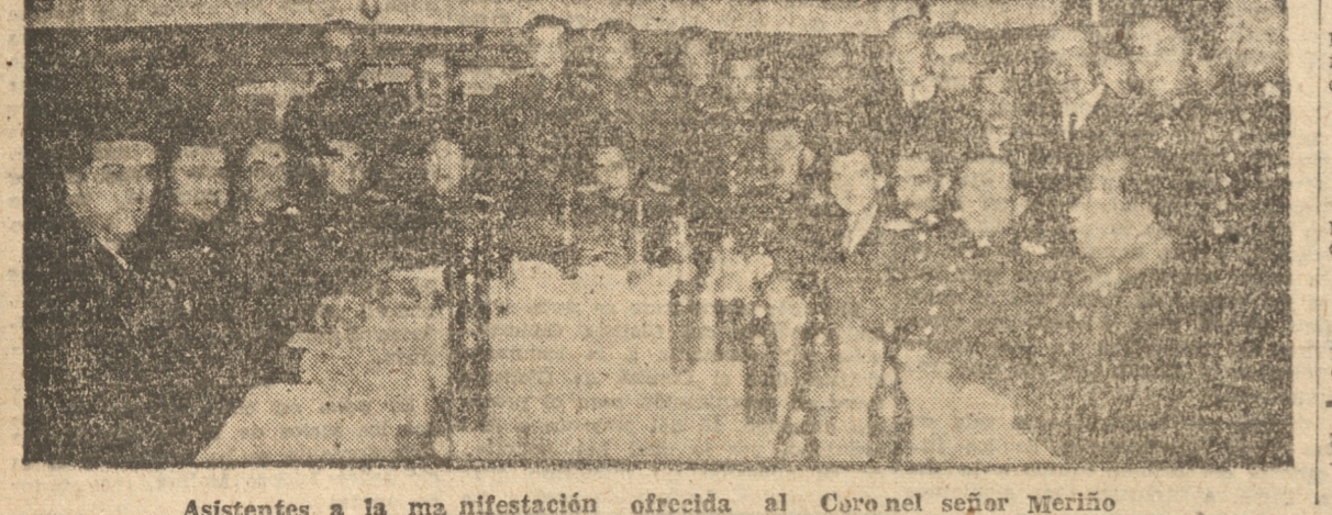
Asistentes a la manifestación ofrecida al Coronel señor Merino

Se dió término a ella más o menos a las 18.30 horas, ya que el distinguido jefe festejado, se dirigió al norte por el tren nocturno.