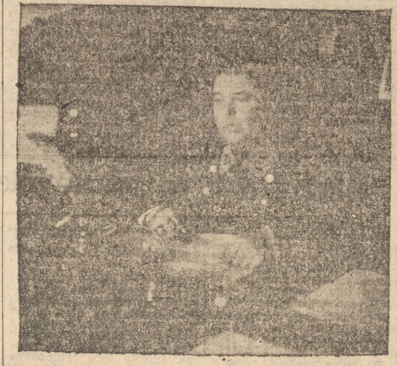
Comandante don Juan N. Blanco V., nuevo prefecto, General de Carabineros de Concepción

horas, el nuevo jefe señor Blanco Valdenegro, se reunió con los oficiales de carabineros de la región con quienes departió algunos momentos, y conversó sobre cuestiones relacionadas con el servicio.