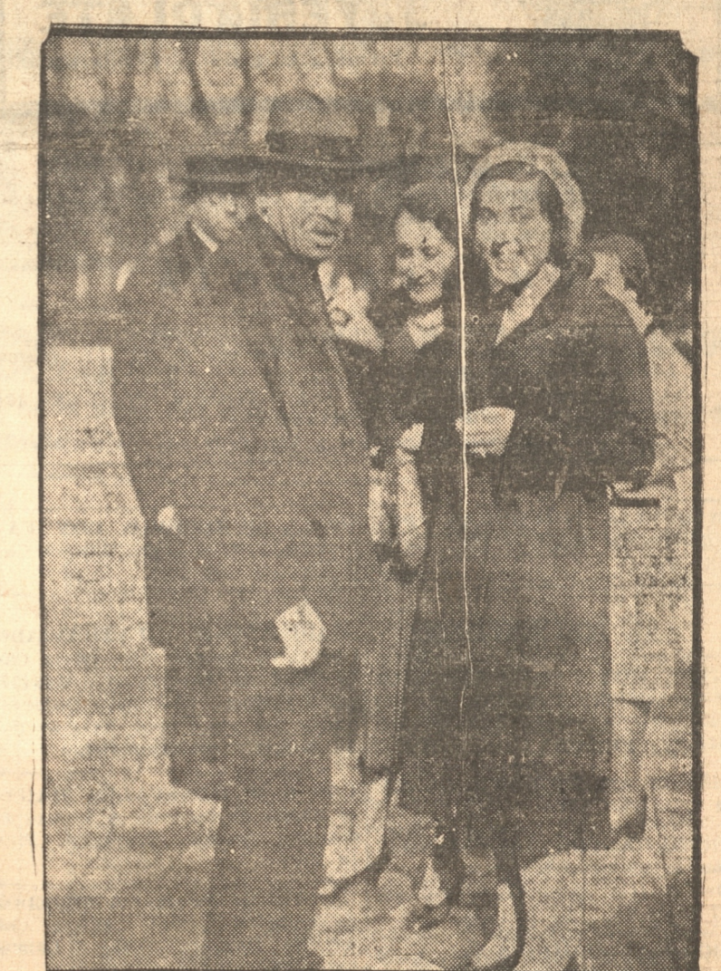
Durante la colecta efectuada ayer

Agradecimientos al público y damas que formaron las comisiones