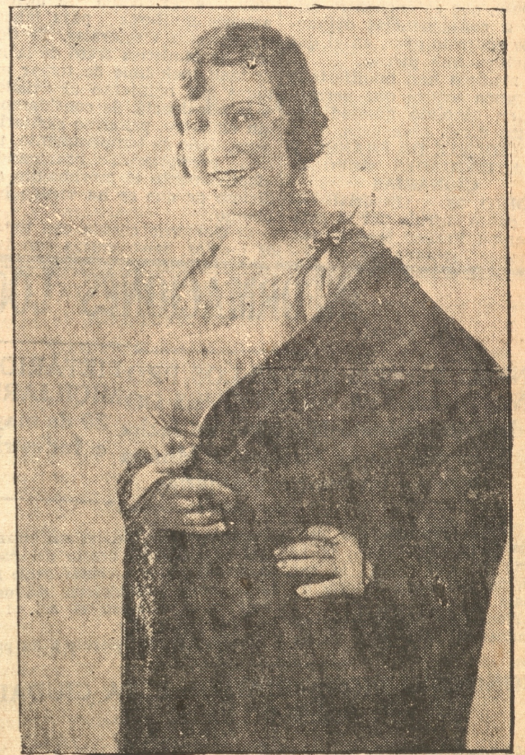
DORINI DI DISSO

EMPORIO TARDON O'Higgins esquina Colo-Colo El que con sus precios combate la crisis.