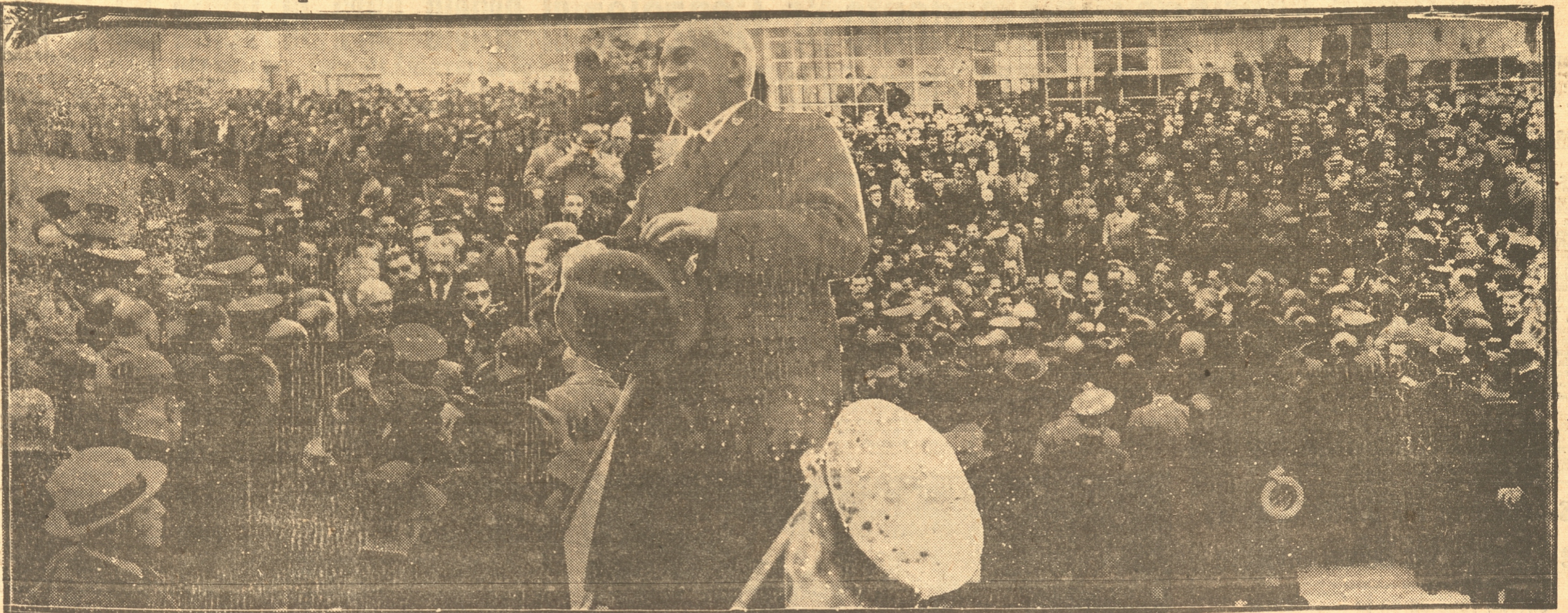
DAMOS ALGUNOS ASPECTOS DEL TRIUNFAL RECIBIMIENTO QUE EL MIERCOLES ULTIMO TRIBUTÓ SANTIAGO AL EMINENTE CIUDADANO