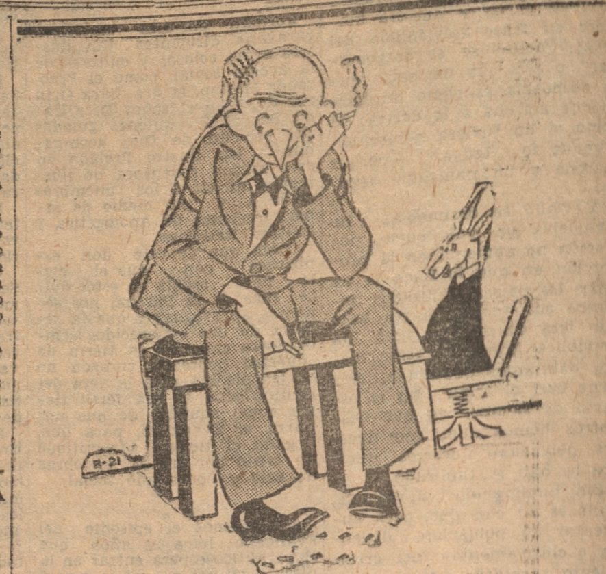
(De "El Romancero de Pipo")

TERMINADO EL MONTAJE DEL AVION DE CODOS Y ROSSI. PARIS, 1.º.— El montaje del avión "Joseph Le Brix" de los avia dores Codos y Rossi con el que quieren mejorar su record del mundo de vuelo sin escala ha quedado terminado esta mañana en los talleres Bleriot.