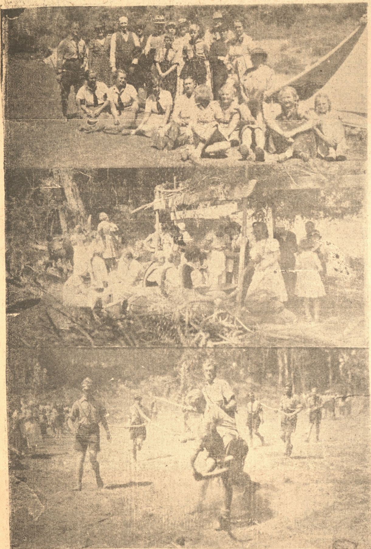
FAMILIAS DE LA COLONIA ALEMANA VISITANDO LOS CAMPAMENTOS SENORITAS PREPARANDO EL ALMUERZO DURANTE UN PARTIDO DE CHEUCA

Familias de la Colonia de todos los pueblos de la región concurrieron a esta festividad... EL INTENDENTE VISITÓ LA CONCENTRACION DE NIÑOS ALEMANES EN "LOS PINARES"