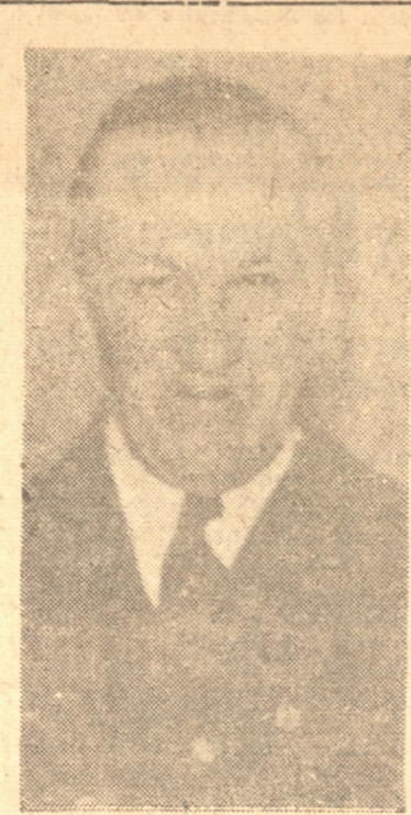
En la Sección Bienestar