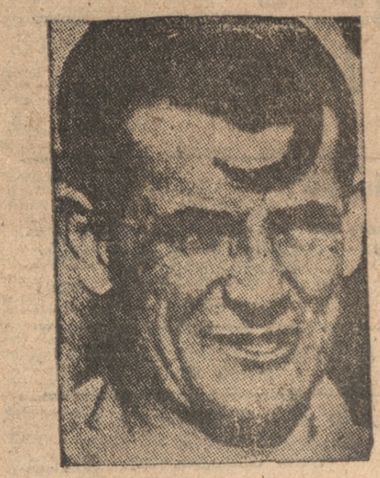
NAZASSI, la gran figura del football oriental