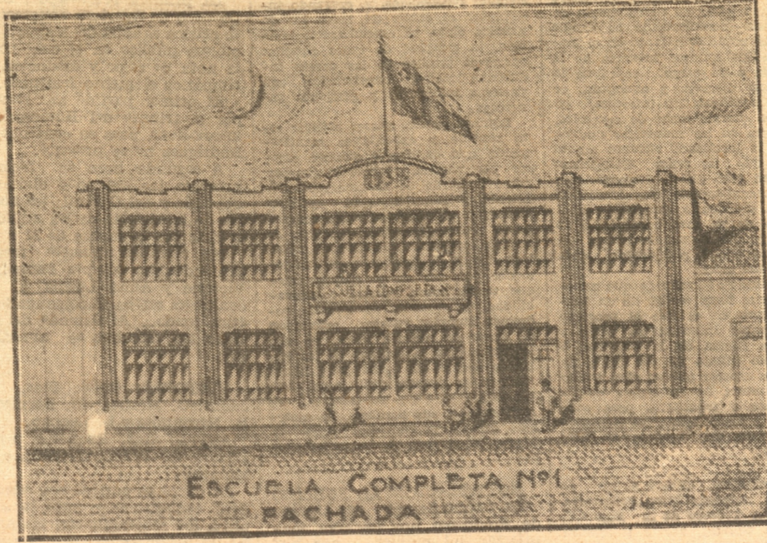
FACHADA DE UNA ESCUELA SEGUN EL PROYECTO MARITANO

Por nuestra parte, seguiremos ocupándonos de este problema, y abogaremos para que las escuelas funcionen en edificios que como tal tienen el debido rol educacional.