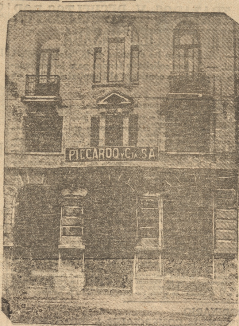
borados todos sus productos y repartidos al norte y sur del país.