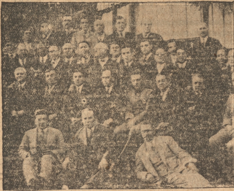
Grupo general de asistentes a la fiesta del club "Tome" de Tiro al Blanco.

El Club de Tiro al Blanco celebró su 15.º aniversario.— Se inauguró un nuevo stand