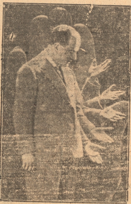
ROODY, en uno de sus experimentos

ROODY SE PRESENTA EL 23 EN EL CONCEPCION