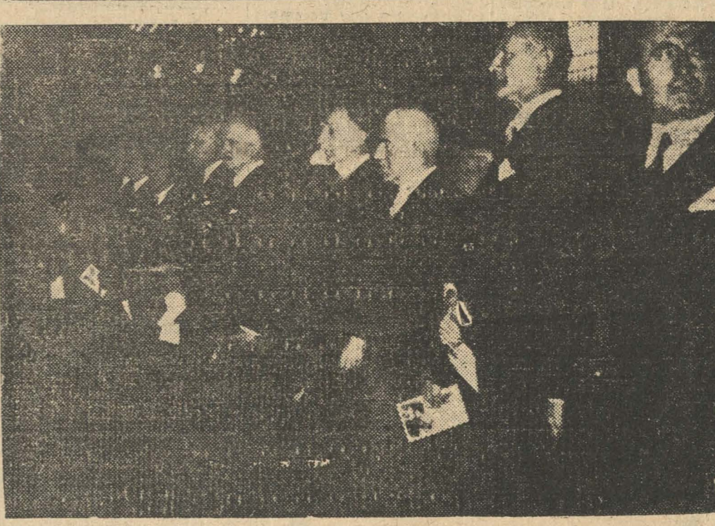
La apertura de la Universidad se celebró solemnemente en París, en presencia del Presidente de la República, M. Albert Lebrun, y del Ministro de la Educación Nacional.

Según el plan de trabajo entregado al Ministro de Fomento se necesitarían para el curso del año $ 190.000.000 incluyéndose los gastos de construcción de escuelas, serVICIOS públicos, hospitales, cárceles, cuarteles para carabineros, etc. suma ésta que estudiará el señor Schnake conjuntamente con el Vice presidente de la Corporación de Reconstrucción y Auxilios en lo que respecta a su distribución, con el fin también, de que ella se encuadre dentro de las entradas de que dicho organismo dispone para el año 1940.