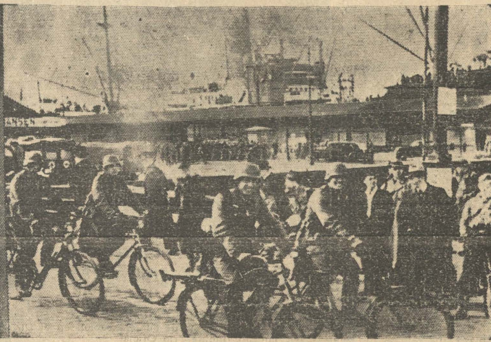
Un regimiento de ciclistas alemanes entra a Oslo, el día mismo en que fué ocupada Noruega

ces rechazaron varios ataques de la patrulla enemiga en Nied. La fuerza aérea francesa efectuó varios vuelos nocturnos en Alemania, después de cuatro vuelos nocturnos del enemigo el martes, en que llegaron a las afueras de París. La aviación alemana estuvo activa todo el día de ayer en la parte oriental de Francia.