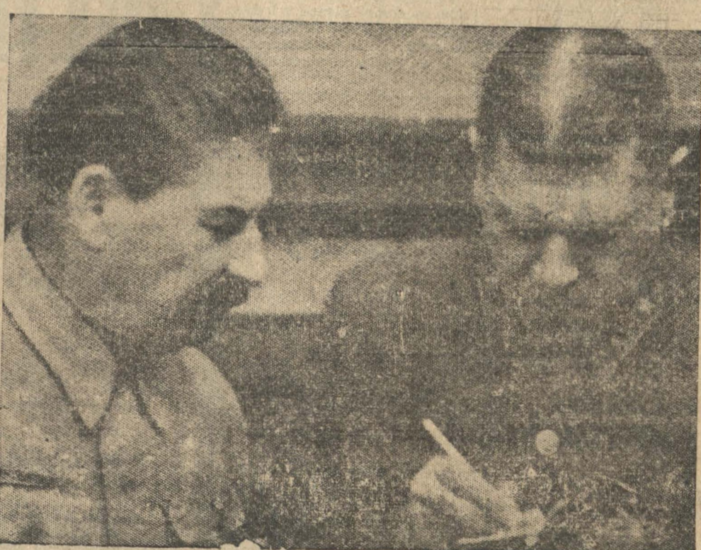
STALIN Y VOROSHILOV. Ambos aparecen estudiando planes militares al iniciarse la campaña de Finlandia. Ahora, como lo informa el cable, el comisario de Defensa del Soviet ha sido removido de su cargo.