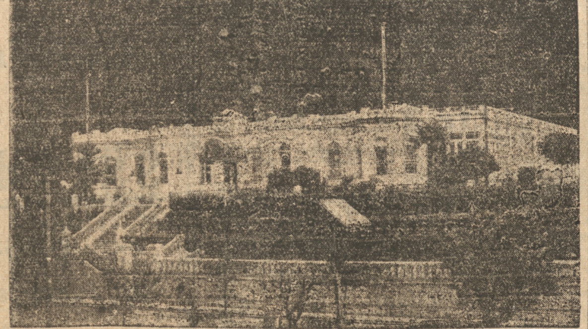
COMANDANCIA DEL APOSTADERO NAVAL DE TALCAHUANO