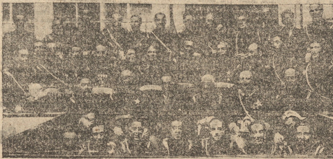
ASISTENTES AL ALMUERZO DE AYER