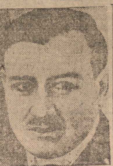
M. DALADIER, cuyo Gabinete cayó debido a difícil situación política

El Ministro accedió a varias peticiones, particularmente a la relacionada con la entrega de medio millón de pesos para el fomento de la industria pesquera en Antofagasta.