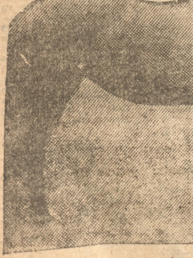
MAJORQUE, la gran yegua de cría, con un potrillo al pie

Belleite es tordilla, hija de Bajajoz (Gost) padre también de Empard, llamado el Caballo del Siglo, y de Bellita (Le Souvenir). Ha dado a Belle Plein y Belleur. Marianne, por Rainy y Marnia, ha dado a Artilleur, que está co-