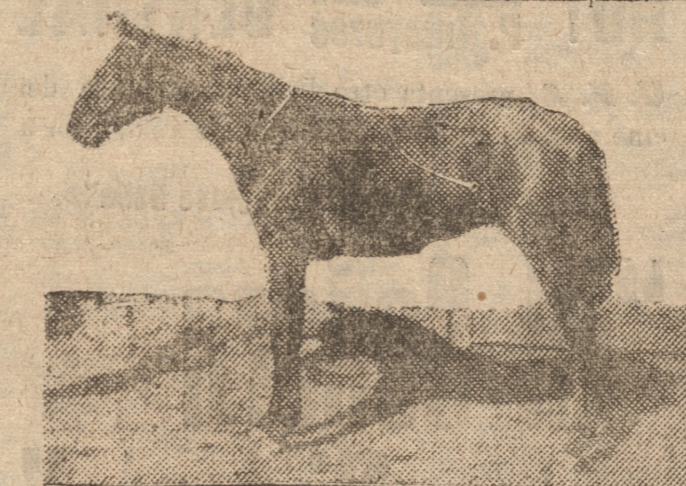
ARTILLEUR, que lleva de segundos entre los dos años

Ardeur, una pequesísima tres años, que no debe medir 1.50 metros de altura, fue intentada adquirir en $ 10.000, proposición que el señor Aninat no aceptó con tan buen acierto como pudo comprarse el domingo, en que la chiquita ganó al galope en 1.400 metros a un grupo de buenos elementos.