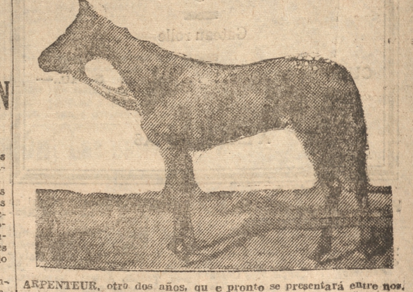
ARPENIEUR, otro dos años, que pronto se presentará entre nosotros

Se impuso en buena forma en la última carrera del domingo El Stud El Lorito, que desde principios de año ha venido bregando con su pupilo Necul, y que ahora último ha aumentado su efectividad con Filito y Necul, no había podido gozar en todo el año de las delicias de un triunfo. Primero fue Necul que entró segundo de Hojuelita, y el domingo Filito alcanzó la misma colocación en la primera carrera. Parecía que una "mala pata" seguía a los pupilos de El Lorito, pero Necul, en la prueba de clausura, se encargó de romper esa racha de mala, y se impuso, eso sí que con todo lo que tenía, sobre sus acompañantes de la última carrera. A lo mejor ahora estos representantes de El Lorito se acomodarán a ganar, y comienzan una serie de triunfos.