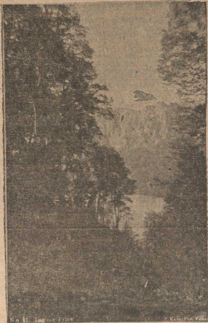
LAGUNA FRIAS, EN EL LADO ARGENTINO