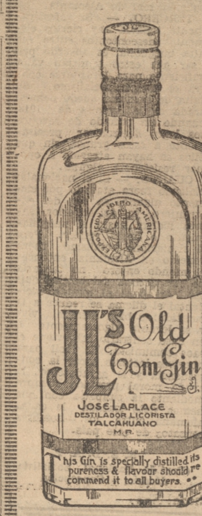
hijo de la specially distilled its pureness & flavor should be commended to all buyers.