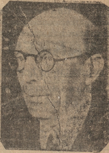
RICARDO SAMPER que anunció que hoy estaría formado el nuevo Gabinete

Don Ricardo Samper salió de la casa del señor Lerroux a las nueve de la noche. Al salir dijo: "Mañana a primera hora habrá Gobierno radical, con algún elemento más".