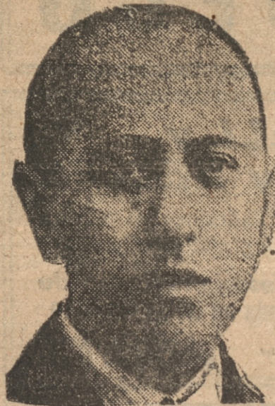
GIL ROBLES, el líder político que declaró que el nuevo Gabinete duraría poco

Martínez Velasco fracasó en sus gestiones para formarlo.— Gil Robles declaró que si Lerroux forma un Gobierno de minoría lo derrocarían en la primera sesión del parlamento.— Se considera muy grave la situación que se presenta en España.— Don Ricardo Samper expresó que hoy a primera hora habrá Gobierno radical