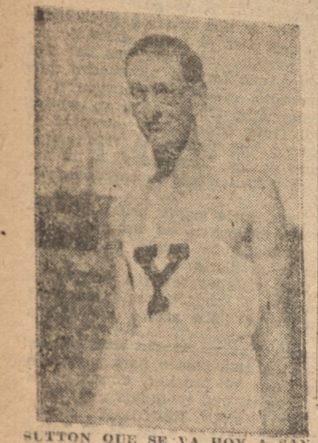
SUTTON QUE SE VA HOY A SANTIAGO A CONCENTRARSE

En el Perú se hace así y el éxito ha sido rotundo, por que ha formado una nueva mentalidad en las instituciones, el deso de popular a países o países de los diferentes equipos, pues, mientras mejor sea la figura en el campeonato mayor serán las probabilidades de conseguir el título de "Club Campeón".