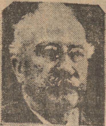
LERROUX, a quien nuevamente se ha encomendado la misión de reorganizar el Gabinete

MADRID, 2. — (UP). — A las 3.30 de la tarde el señor Gil Robles llegó al domicilio de Lerroux manifestando que había