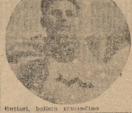
Buttori, balista transandino

En el Perú se hace así y el éxito ha sido rotundo, por que ha formado una nueva mentalidad en las instituciones, el deso de popular a países o países de los diferentes equipos, pues, mientras mejor sea la figura en el campeonato mayor serán las probabilidades de conseguir el título de "Club Campeón".