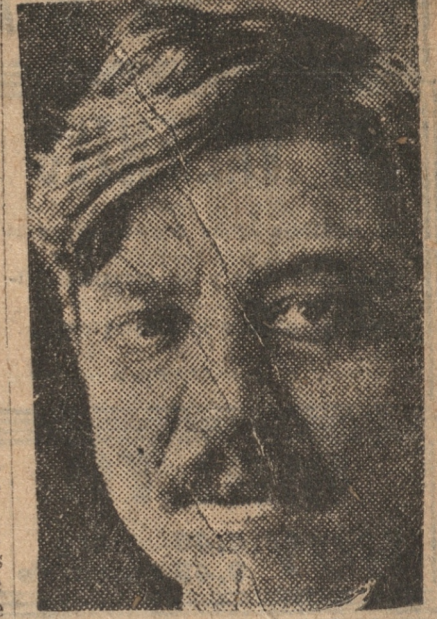
M. PIERRE LAVAL

LONDRES 3.—(UP). — Un portavoz de la delegación francesa, con respecto a los representantes de la prensa, anunció que el acuerdo anglo-francés demostraba el deseo y la intención de tratar a Alemania sobre la base de igualdad, por las siguientes razones: por primera vez Gran Bretaña y Francia han expresado oficialmente sus deseos de anular la Sección 5.a del Tratado de Versalles; porque se ha invitado a Alemania a participar en el Pacto Aéreo, a pesar de que oficialmente no está aun autorizada para tener aeroplanos militares, porque en el comunicado está manifestado en repetidas veces que se negociarían en el futuro acuerdos