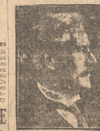
M. RAMSAY MACDONALD