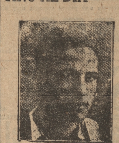
LAURI EL CODICIADO WINGER BONAERENSE

Ya están de nuevo en Buenos Aires los equipos de Boca Junior y River Plate, que andaban en jira en el Brasil.