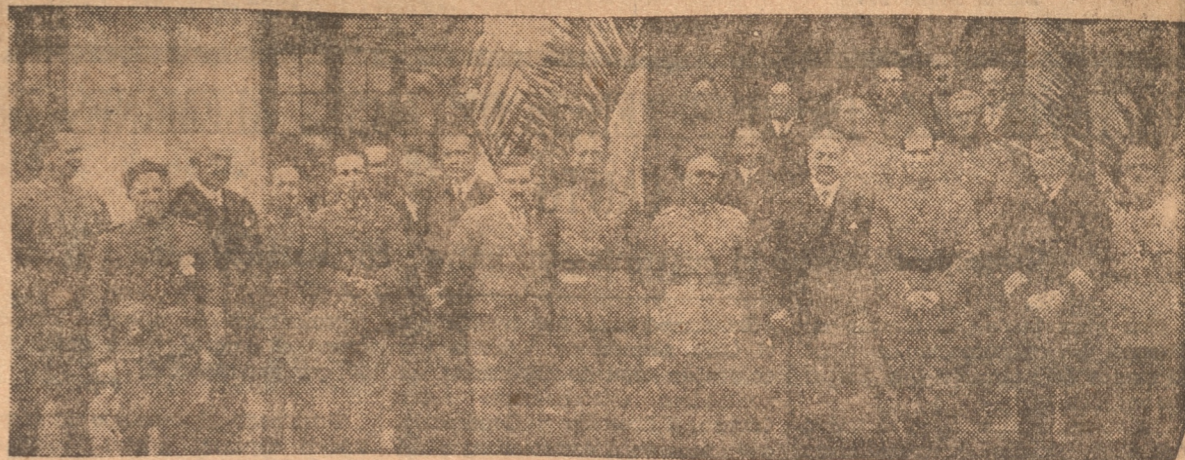
EL INTENDENTE DE LA PROVINCIA RODEADO DE LAS AUTORIDADES MILITARES Y OTRAS PERSONALIDADES ASISTENTES AL ALMUERZO DE AYER

De acuerdo con lo anunciado, ayer a las 12.30 horas, se efectuó un almuerzo en el Casino de Sub Oficiales del Regimiento Chacabuco, en conmemoración del día del Ejército.