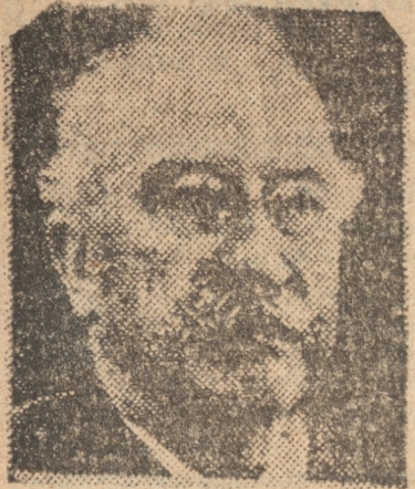
ALEJANDRO LERROUX, jefe del Gobierno Español