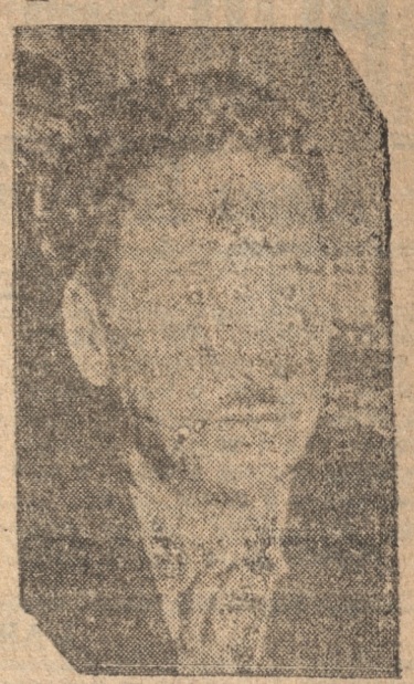
LUIS COMPANYS, Presidente de la Generalidad Catalana.

asalto a Elbar, llevando consigo morteros de trinchera y ametralladoras. En toda Cataluña se ha suspendido el servicio de trenes, y la huelga. (Pasa a la 4.a Pág.)