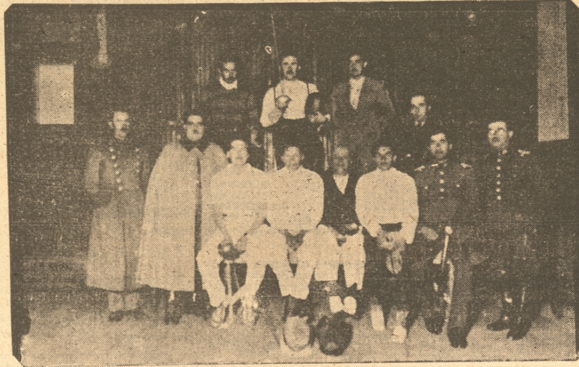
Aficionados asistentes a la primera reunión y clases del Club de Esgrima Concepción

El lunes se iniciaron las prácticas. — El gimnasio del Instituto Comercial ha sido prestado para su desarrollo. — Todo el mes permanecerá abierta la inscripción para socios fundadores. — Mañana prosiguen las clases. — Esgrima para damas. — Reunión de directorio