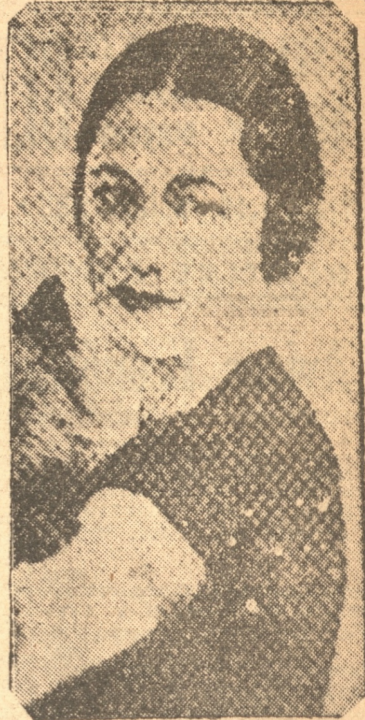
Mrs. WALLIS WARFIELD

El nuevo matiz fue preparado especialmente para ella por Mainbecker. Es también el color preponderante en el trousseau. Su traje tenía una larga cola y el cuello su-