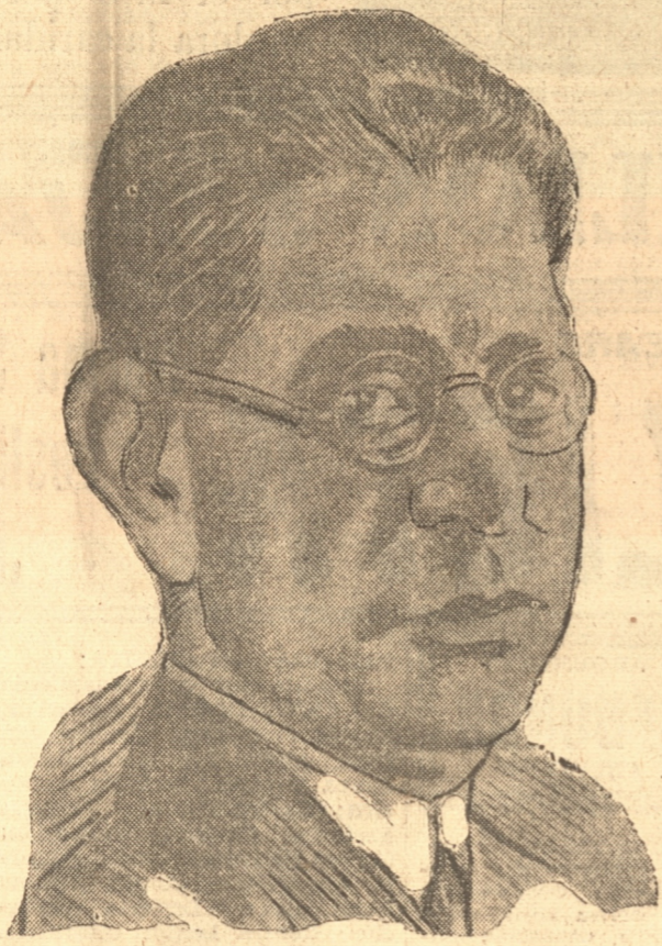
GENERAL EMILIO MOLA

LONDRES, 3.— (UP).— El correspondiente del "Daily Telegraph" en