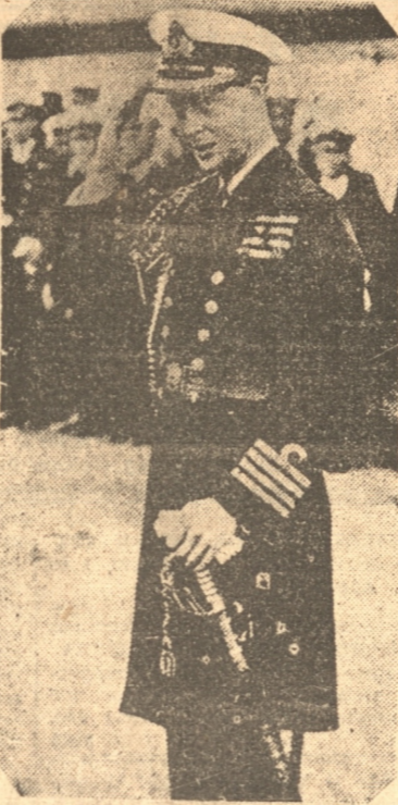
DUQUE DE WINDSOR