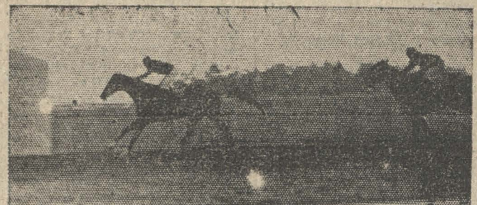
Jaranero. Como de costumbre hace suya la última

El juez demoró bastante en dar la partida ya que varios estaban muy mafiosos en ella sobresaliendo Amateur, Loncero que en ningún momento hizo amago de hacercese a las huinchas (??) Amasseur y sobretodo Jaranero. La partida vino en buen momento para los que iban a la pelea y Cointreau corrió algunos metros en punta para luego ceder esta colocación a Jaranero, el cual se cortó varios cuerpos sobre el lote que encabezaba Cointreau, un poco antes de la curva Amasseur desalojó del segundo puesto a Cointreau y empezó a presentarle lucha al puntero el cual se defendió bien; la curva fué girada en buena forma por el puntero quien no perdió pulgada de terreno lo que le valió para ganar la carrera, ya que precedió a Amasseur por cabeza, a tres cuerpos llegó tercera, Consejera, delante de Cointreau.