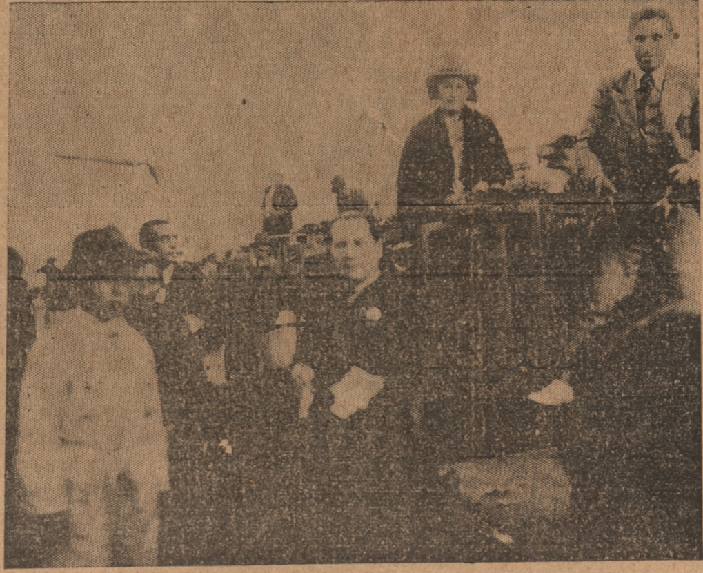
A esa hora de la madrugada hay en la Feria Libre un movimiento intenso. Al lado de la revendedora, tras el muchacho, puede verse al empleado municipal encargado de cobrar los cotidianos derechos de alcabala.

algunas declaraciones. Dice que es cierto que las frutas, las verduras y otros artículos han experimentado una fuerte alza, de la cual no hay que culpar a las personas que, como ella, venden directamente al consumidor desde la tierra. Ella vende por cuenta de un señor que es propietario de una quinta en los alrededores. Este año, al principio hubo una sequía, que perjudicó mucho a las plantas, amenazando con una mala cosecha, pero lo que echó a perder todo fué la lluvia de pocos días atrás. Por su culpa las plantas no rindieron más y habiendo pocas verduras hay que venderlas más caras, pues señor, nos dice.