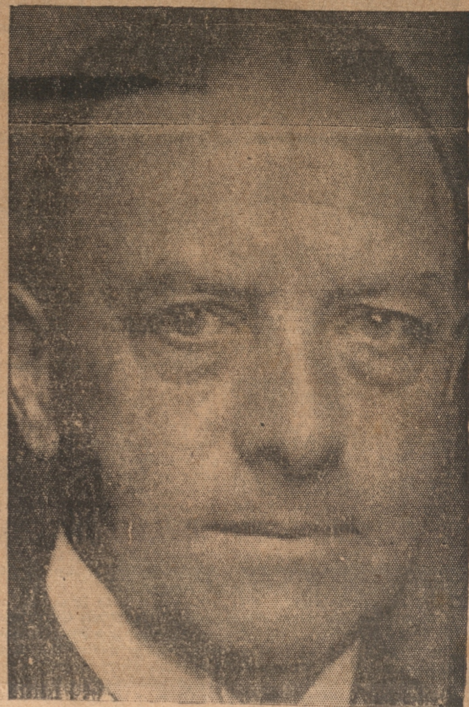
El Gran almirante Roeder, jefe de la marina alemana. Se dijo, hace pocos días que las unidades de esa Armada se habían dirigido al Mar del Norte.

Esto es lo que ha irritado a nuestro pueblo y le ha dado una unidad desconocida en todas las guerras anteriores. A los que se preparan a servir al país en tierra, mar y aire envío mis saludos en esta oportunidad. Creo de todo corazón que nos une a todos mis pueblos y a nuestros valientes y fieles aliados, es la causa de la civilización cristiana, pues sobre ninguna otra base puede edificarse una verdadera civilización. Llegó un nuevo año y no podemos prever lo que nos traerá, pero si nos trae paz cuanto lo agradeceremos y si nos trae la continuidad de la guerra nos mantendremos sin cesar."