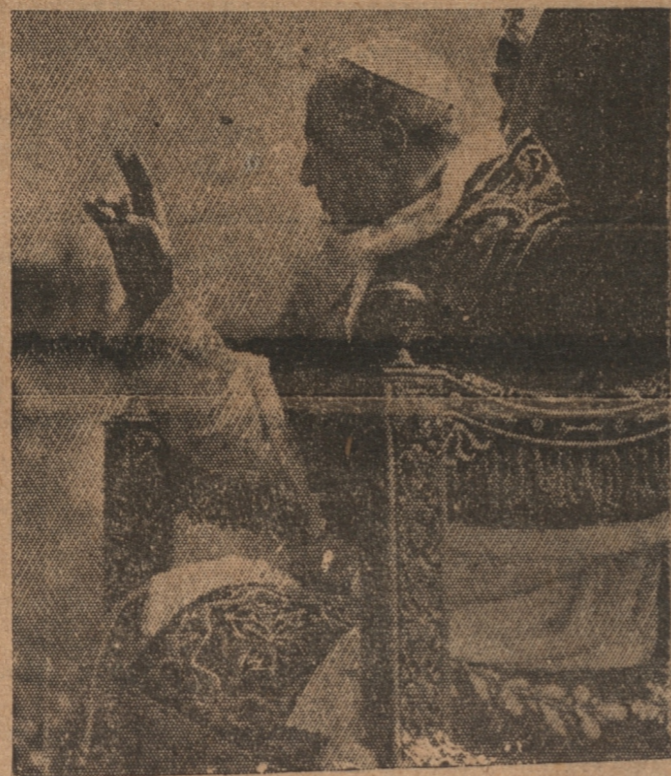
S. S. PIO XII, que el jueves próximo visitará al rey de Italia, en el Quirinal. Excepcional importancia se da en los círculos europeos a esta visita

El cañón de largo alcance ruso bautizado por los finlandeses con el nombre de "gran Bertha ruso" reanudó anoche su bombardeo de Viipuri, iniciado la noche anterior.