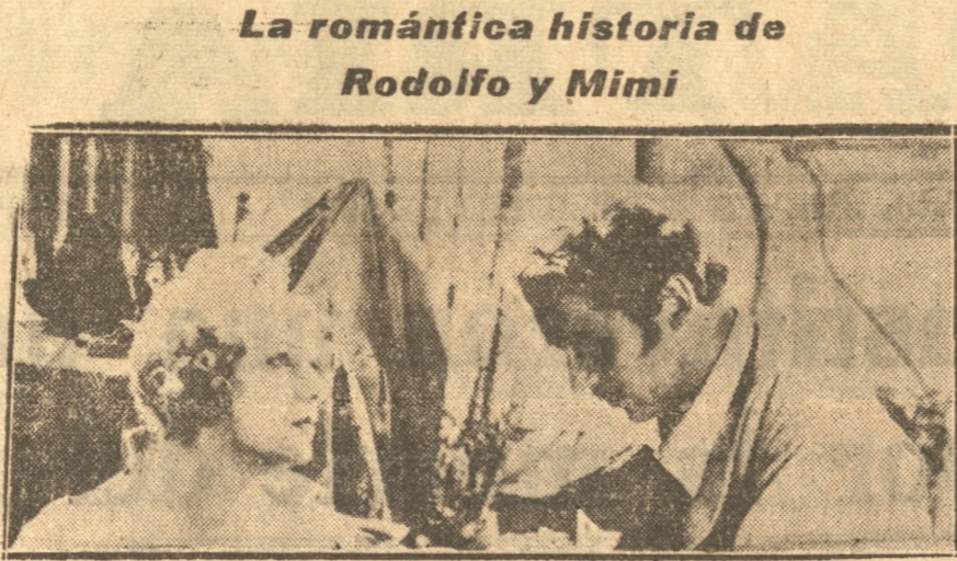
La romántica historia de Rodolfo y Mimi