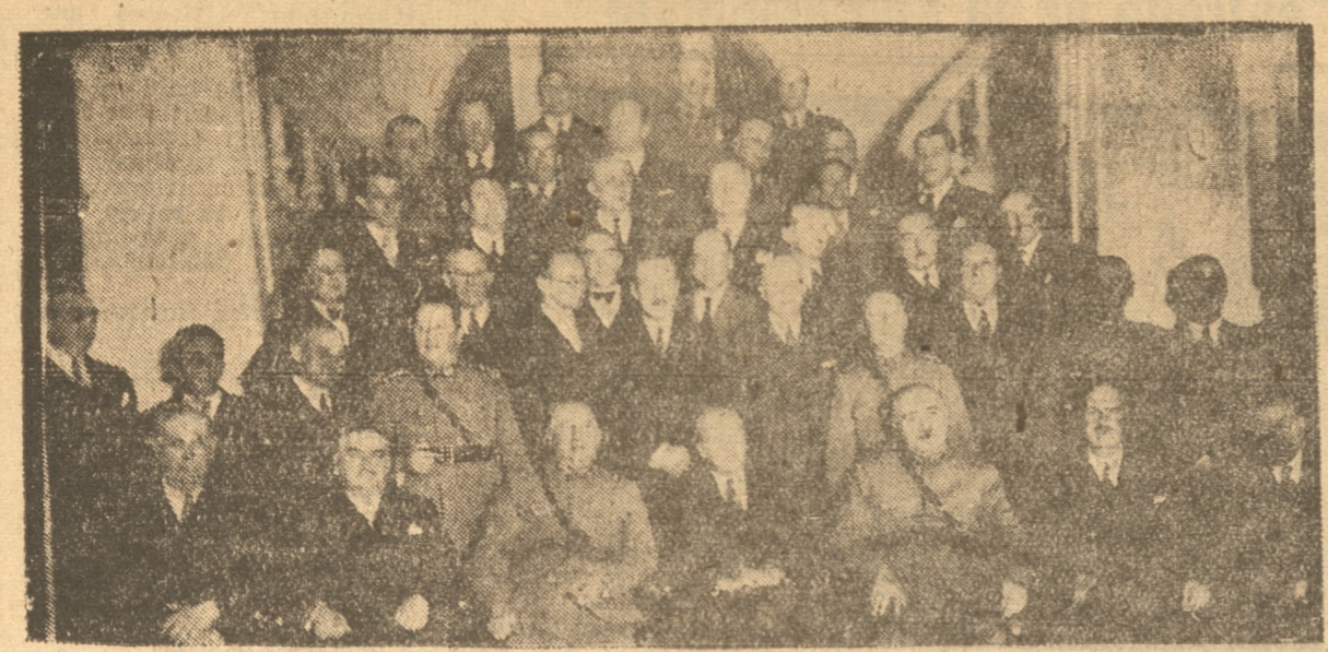
ASISTENTES A LA MANIFESTACION OFRECIDA ANOCHÉ POR EL ROTARY CLUB EN HONOR DEL GENERAL GORDON

ASISTIERON A ESTA MANIFESTACION ALTAS PERSONALIDADES DE NUESTRA CIUDAD. — LOS DISCURSOS PRONUNCIADOS. — EL VERMOUTH OFRECIDO AYER EN EL CUARTEL DIVISIONARIO. — LOS DEMAS FESTEJOS EL ALMUERZO QUE OFRECE HOY LA OFICIALIDAD