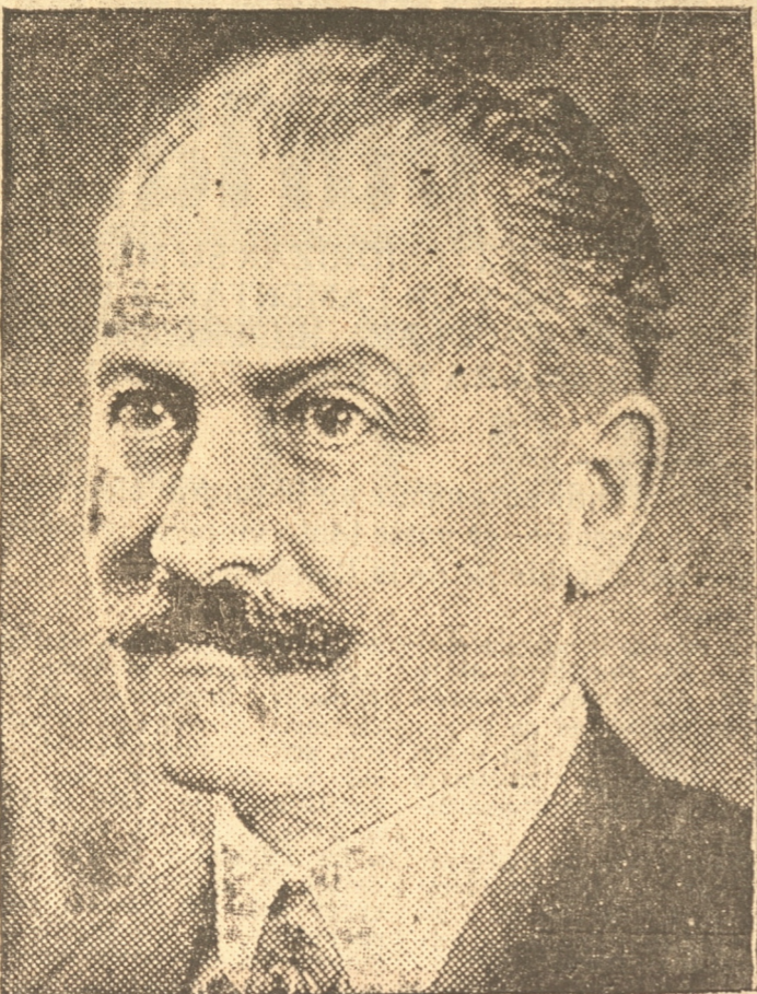
M. Albert Lebrun, Presidente de la República Francesa, nación que hoy celebra su Fiesta Nacional, a la cual se adhieren sus hijos repartidos por todos los puntos de la tierra.