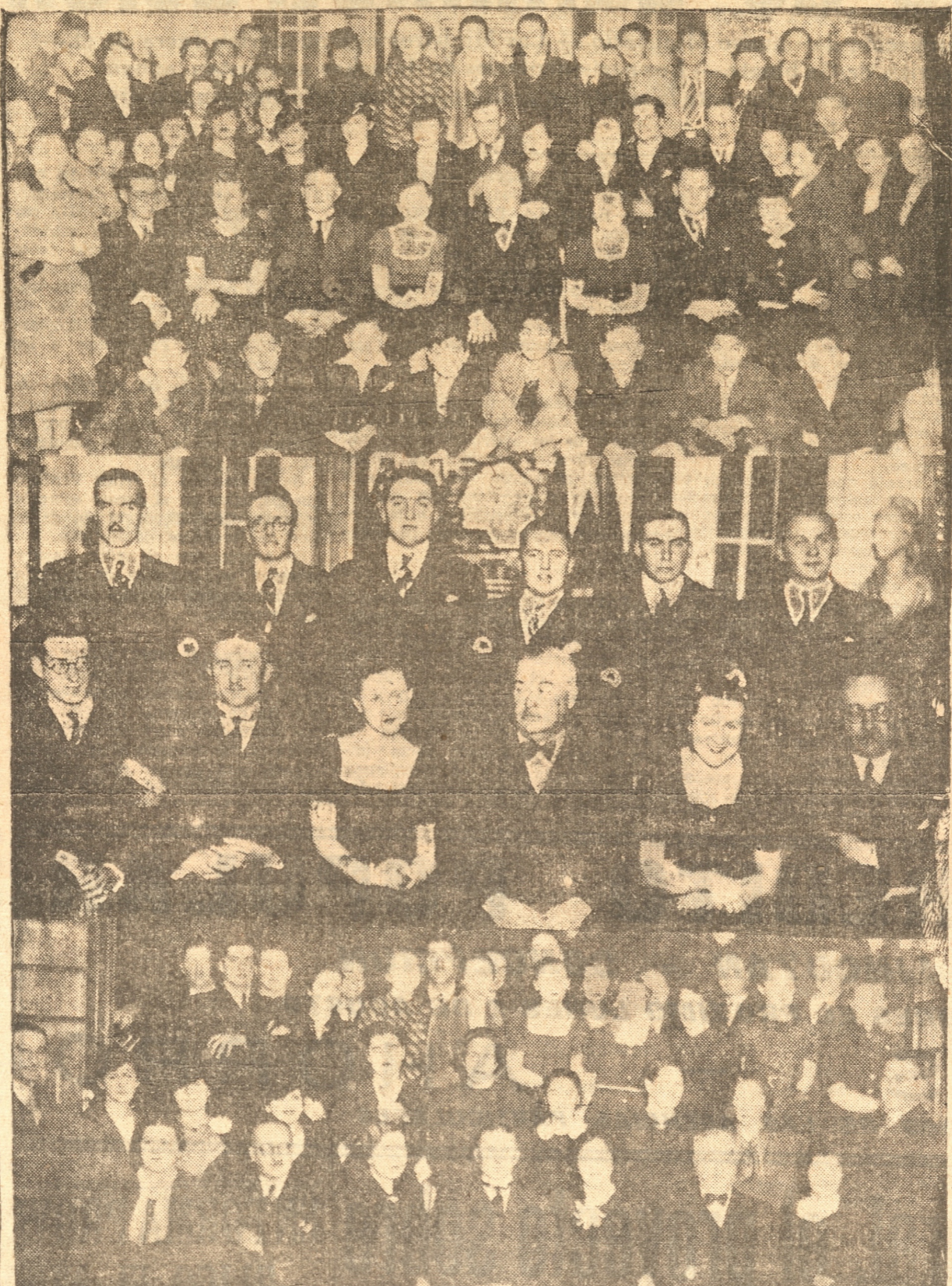
ASPECTOS DIVERSOS DE LOS ACTOS SOCIALES QUE INICIARON AYER LA CELEBRACION DE LAS FIESTAS FRANCESAS.