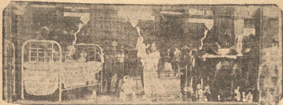
LA ORIGINAL PROPAGANDA DE LA CASA GATH Y CHAVES

juguets de hermosos Juguetes con los cuales juega en medio del mayor alborozo.