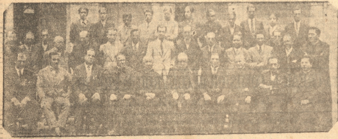
ALGUNOS DE LOS ASISTENTES AL ALMUERZO DE AYER EN EL SEMINARIO

Se efectuó ayer con numerosa asistencia. — Los discursos que se pronunciaron