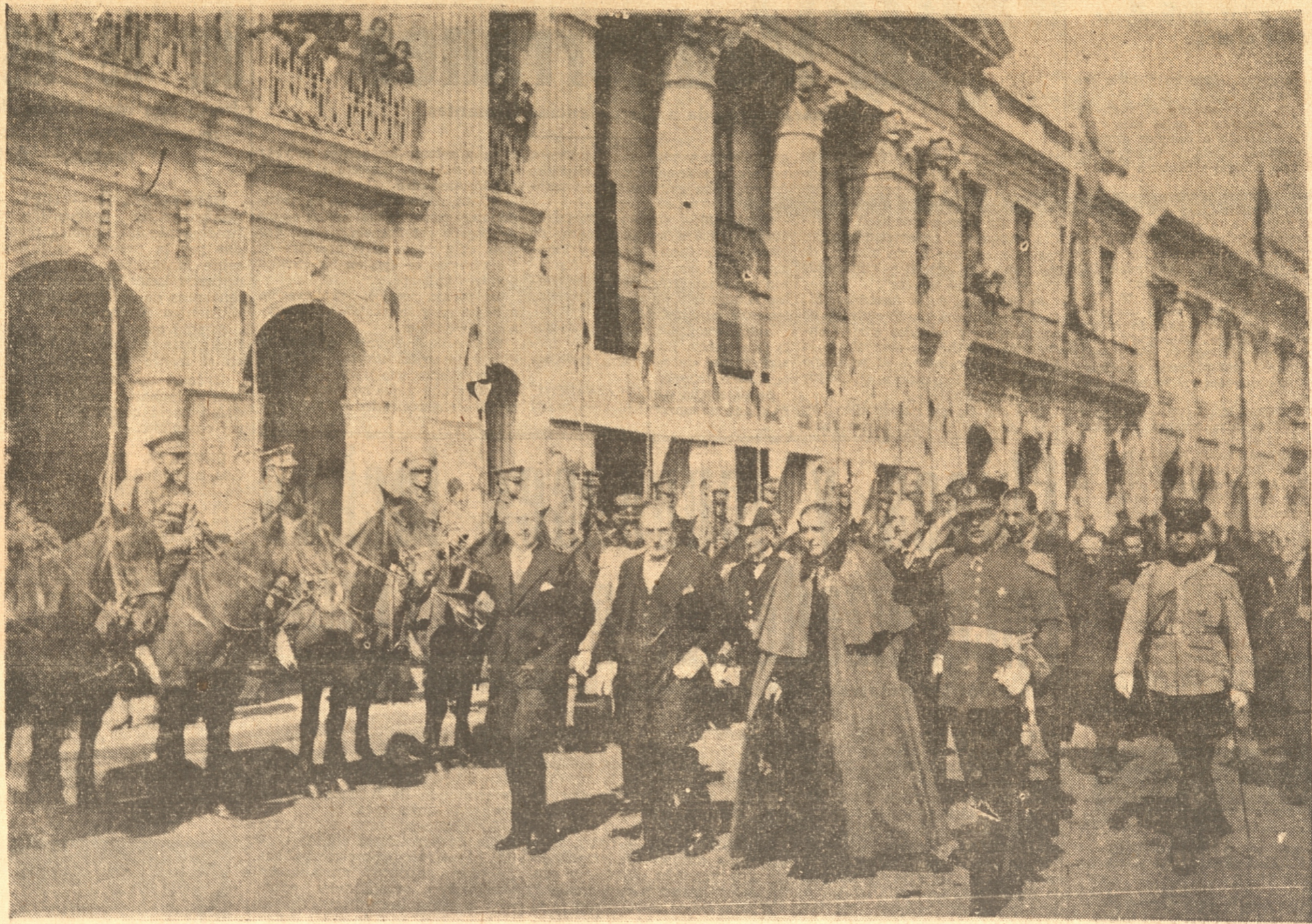
LAS AUTORIDADES REGRESAN DE LA CATEDRAL Y SE DIRIGEN A LA INTENDENCIA DESPUES DEL TE-DEUM

Poco antes de las 10 horas se encontraban formadas en las cercanías de la Catedral y en los alrededores de la Plaza Independencia, el regimiento de Infantería N.º 6 "Chacabuco" con tropa de la columna tren automóvil anexa a esa unidad; el regimiento de caballería N.º 7 "Guías" y el grupo de artillería a caballo N.º 3 "Silva Renard". Al mando de todas estas unidades estaba el coronel don Froilán Arriagada, jefe del Estado Mayor de la III División.