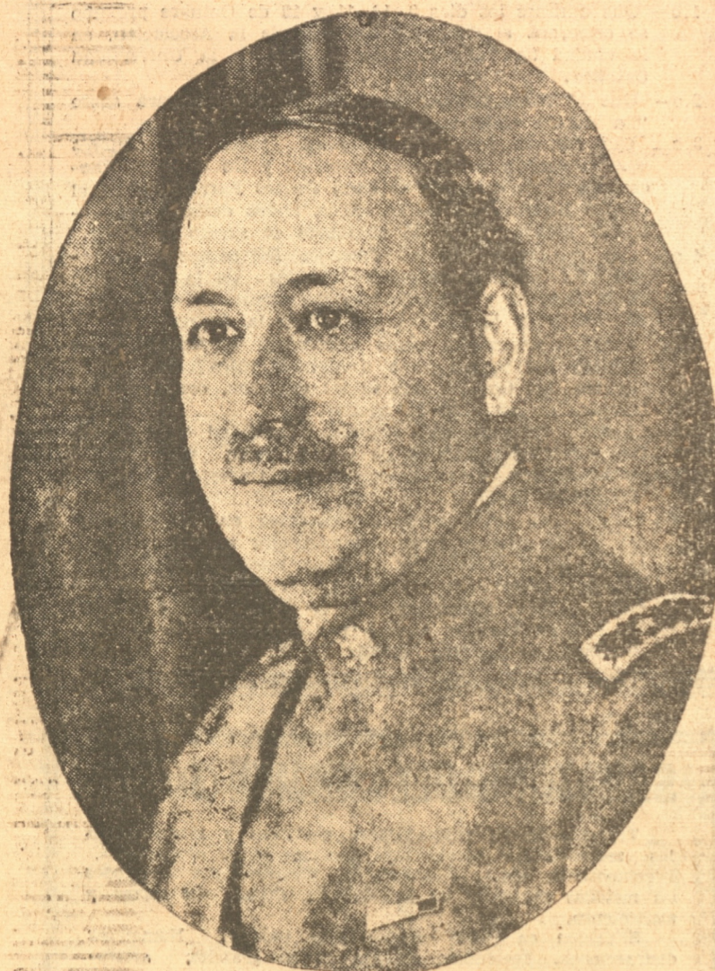
General don Oscar Novoa Fuentetaja, comandante en jefe del Ejército de Chile, institución que hoy celebra el día de sus glorias