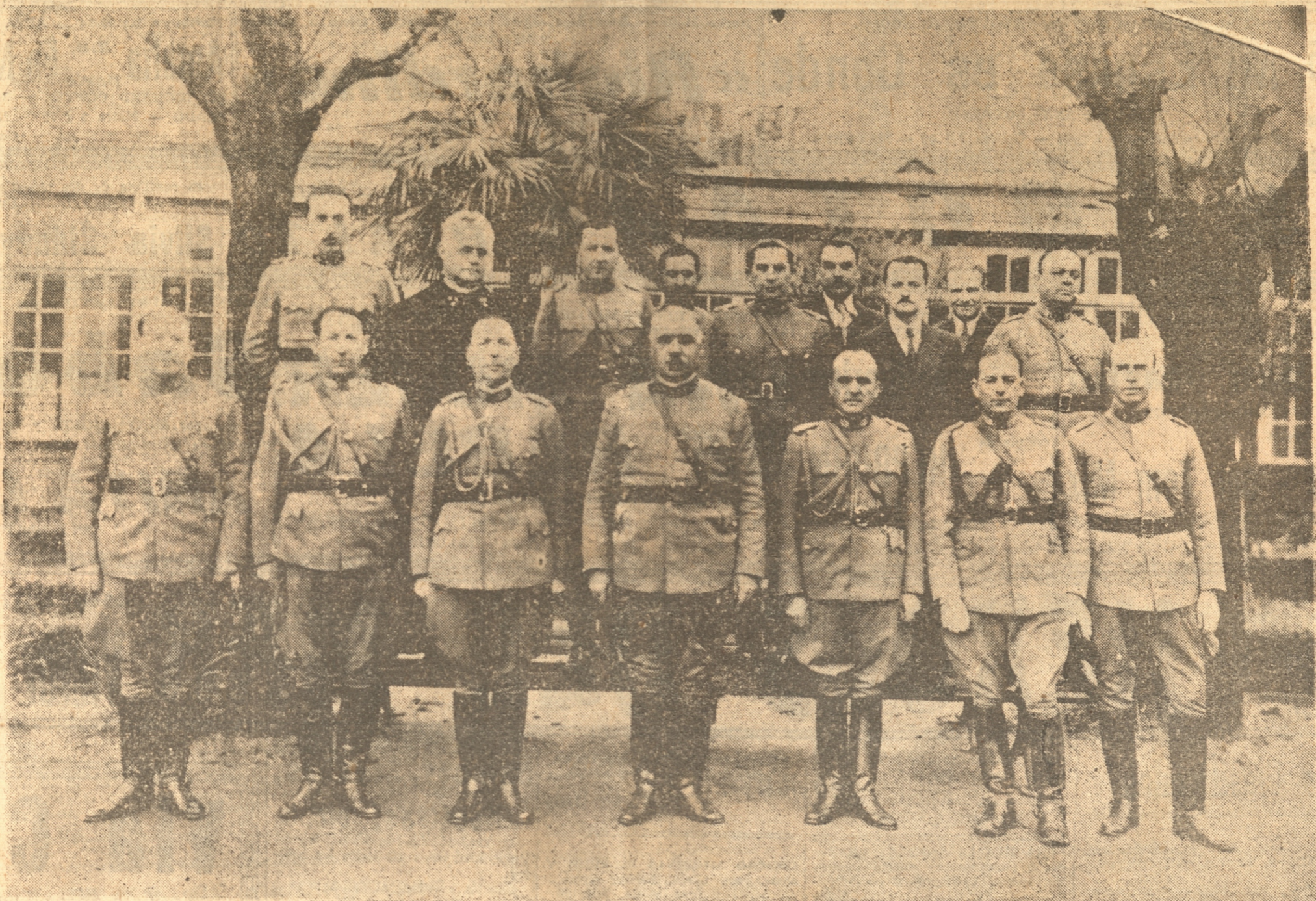
EL COMANDANTE EN JEFE DE LA III DIVISION Y LOS OFICIALES DEL CUARTEL GENERAL DE CONCEPCION

tradición hermosa. Pueden pretender algunas doctrinas de utopías rojas echar sombras sobre el uniforme, sin conseguir nada. El pueblo, ese conjunto que lo forma todo, en su acepción más amplia, ha estado y estará siempre al lado del Ejército que hoy como ayer es el mismo de siempre. El desfile de los batallones no dejará de despertar nunca ese sentimiento que es de todo corazón chileno y que no podrá desaparecer porque con él está ligado el sentimiento de la Patria misma.