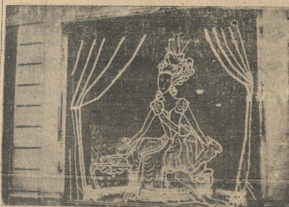
ANTE EL TEMOR DE ATAQUES AEREOS. — Para evitar la quebración de vidrios y cristales durante las posibles incursiones aéreas, los habitantes de París han pegado sobre los vidrios — largas tiras de papel. El dueño de una peluquería tuvo esta feliz ocurrencia combinando la previsión con la reclame de la casa, y las tiras de papel las ha colocado presentando el peinado de una dama del siglo pasado.

PARIS, 27. — (UP). — Se anuncia oficialmente que en París y partes oeste, norte y noroeste de Francia hay alarmas aéreas como resultado de haber cruzado la frontera en diversos puntos varios grupos de aviones alemanes de bombarderos, uno de los cuales tomó rumbo a París donde la alarma aérea duró desde las cuatro treinta y cinco hasta las cinco treinta de la madrugada.