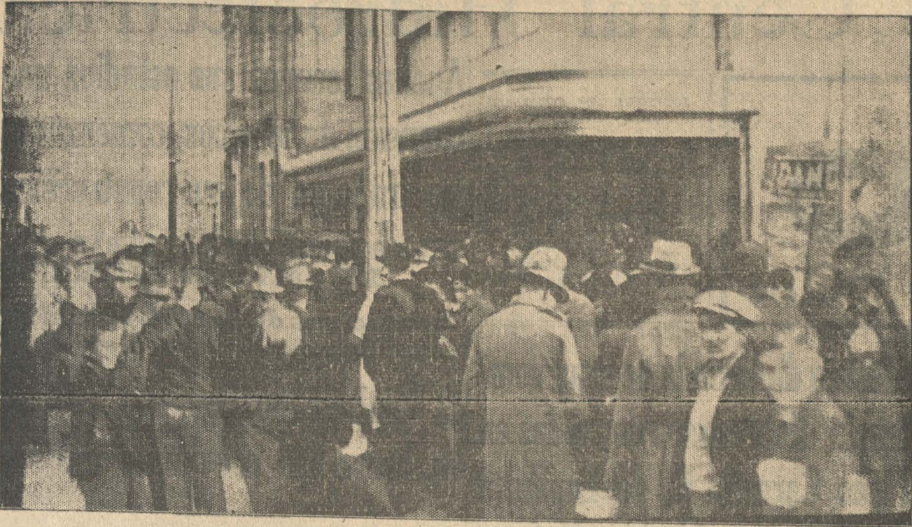
Este fue el espectáculo que ofreció, durante todo el día de ayer, la calle Rengo frente al Teatro Ideal. Cientos de personas esperan que termine una función para entrar a ver la película del gran match En más de una ocasión estuvo interrumpido el tránsito.

Hoy nuevamente en tarde y noche en el Ideal