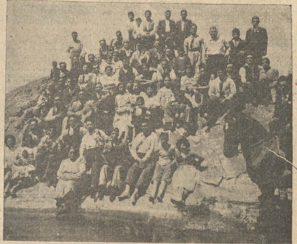
Grupo de asistente al paseo de la Soc. "José M. Balmaceda"

El domingo pasado se efectuó el paseo anual que celebra la Sociedad de Conductores de Vehículos a Tracción Animal "José M. Balmaceda".