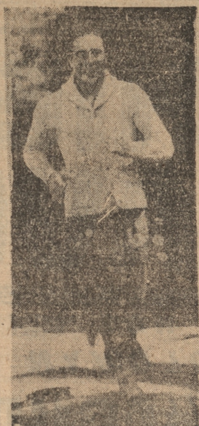
EL CAMPEON MAX BAER, ¿SE RETIRA?