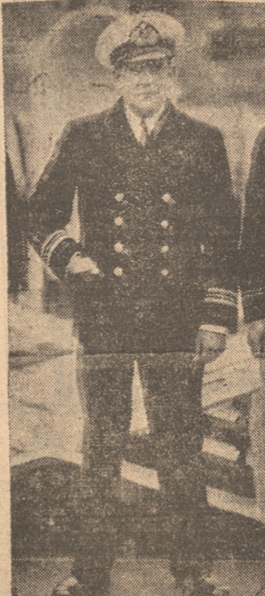
de su familia y a la Armada la expresión de nuestra condolencia más sentida.

La injusticia es casi siempre la ruina infalible de los imperios. HOY San Simplicio MANANA San Celedonio