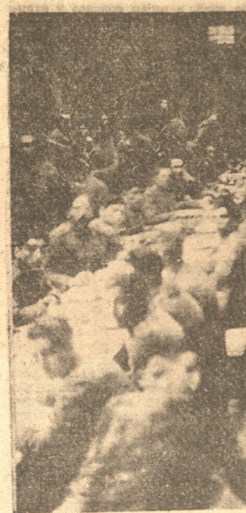
UN ASPECTO GENERAL DE LOS ASISTENTES AL ALMUERZO EFECTUADO EN EL FUERTE BORGONO

Por estas razones, la defensa de las Costas no ampara sólo la seguridad de los puertos militares o de aquellos que poseen bases o perfiles bélicos, sino que también la de todos los puertos capaces de ejercitar un intercambio de comercio vi-