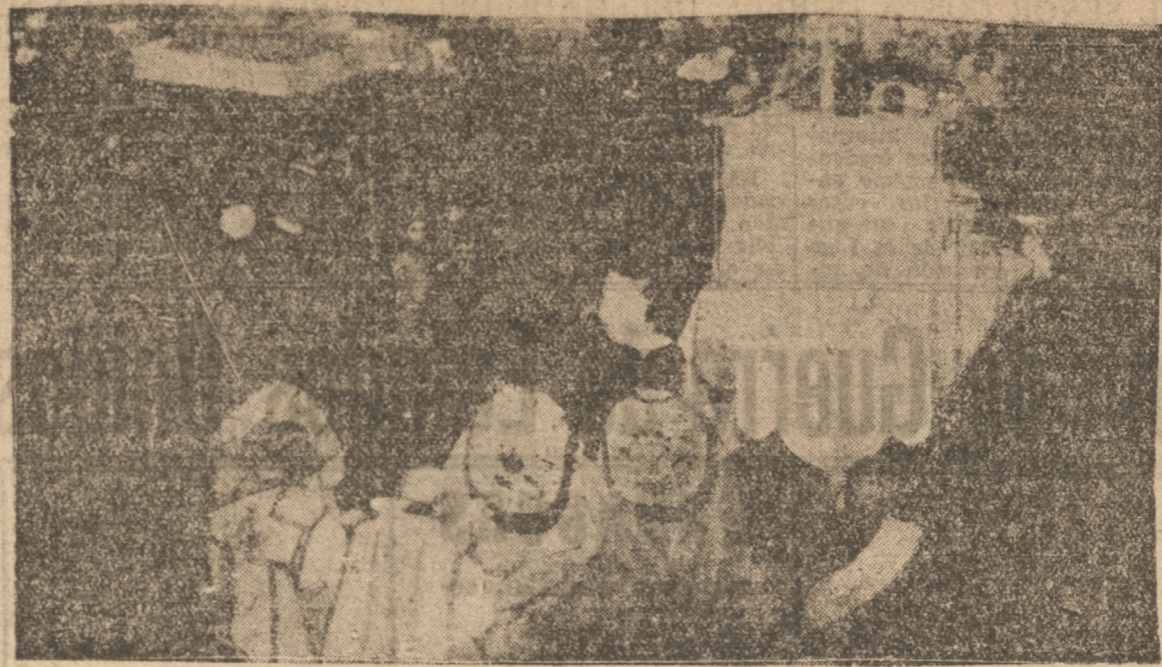
DURANTE LA PROCESION DE CORPUS VERIFICADA EN LA CATEDRAL

DADO EL ESTADO DEL TIEMPO, SE REALIZÓ POR EL INTERIOR DE LA CATEDRAL. — EL OBISPO MONSEÑOR MUÑOZ DIO LA BENDICIÓN. — HOY COMENZARÁ EL OCTAVARIO DE CORPUS