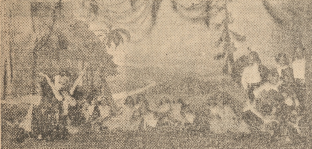
El cuadro de la pampa en el Pabellón argentino

UN SUCESO ARTISTICO INC OMPARABLE EREVE TEMPORADA — LA REVISTA DE LA EXPOSICION IBERO - AMERICANA