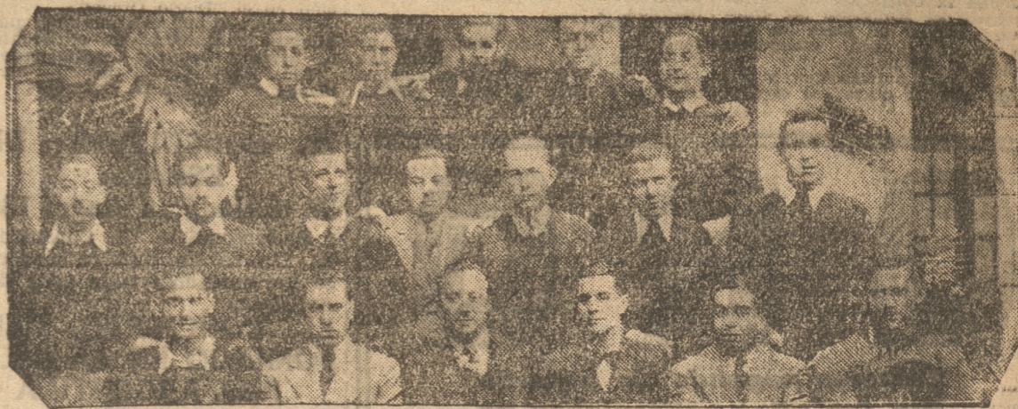
LOS ALUMNOS Y PROFESORES DEL INTERNADO BARROS ARANA QUE VISITAN NUESTRA CIUDAD

Durante algunos días permanecerá en la región, visitando los puntos de mayor interés.— Hoy se dirijirán a Lota.— Los alumnos que integran la delegación