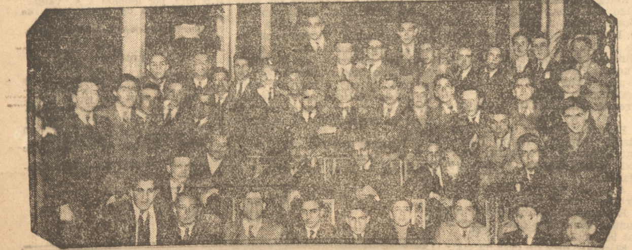
LOS ALUMNOS DEL INSTITUTO NACIONAL QUE SE ENCUENTRAN ENTRE NOSOTROS

HOY VISITARAN LOTA LOS ALUMNOS DEL INSTITUTO NACIONAL Recorrerán el parque y las dependencias de la Compañía Minera e Industrial de Chile.— Ayer visitaron a Talcahuano