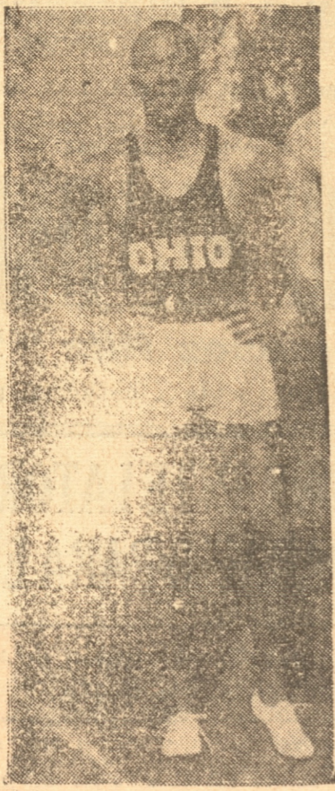
JESSE OWENS El negro velocista de fama mundial

El comité norteamericano de homologaciones de "records" atléticos debió reunirse en diciembre último en Boston para homologar las marcas nacionales y mundiales establecidas en la Unión durante la última temporada, y según se informa también debió homologar el tiempo de 18" 2/10 señalado por el campeón negro Jesse Owen en Chicago el 20 de junio del año 1936.