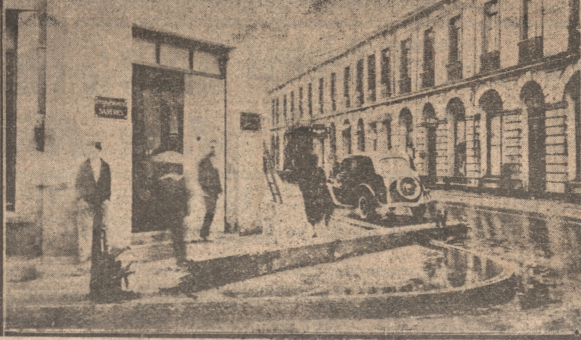
ALGUNOS ASPECTOS TOMADOS AYER EN LA CIUDAD DES PUES DEL TEMPORAL

En la parte céntrica de la ciudad se produjeron dos accidentes que afortunadamente no tuvieron mayores consecuencias. A las 9.30 se cayó en Barros Arana esquina de Rengo un poste del Telégrafo Comercial y otro a me dia cuadra de ese sitio, en Rengo entre Barros Arana y O'Higgins.