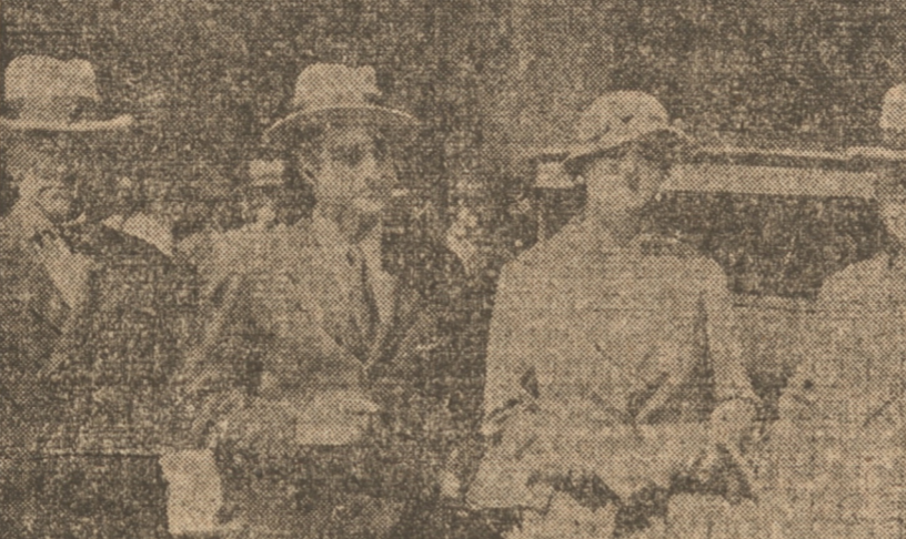
FOTOGRAFIA TOMADA AYER EN LA ESTACION, A LA LLEGADA DE MARIA GUERRERO Y FERNANDO DIAZ DE MENDOZA, QUE ANOCHÉ INICIARON EN EL CONCEPCION, CON SU COMPANIA, UNA TEMPORADA DE ARTE DRAMATICO.