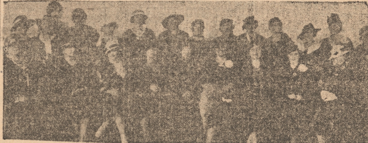
SOCIEDAD DE BENEFICENCIA FEMENINA ITALIANA

Las diversas instituciones con que cuenta