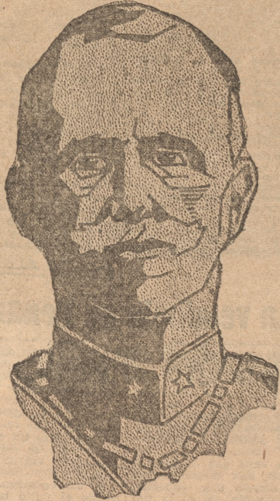
M. VICTOR MANUEL III, REY DE ITALIA

"Banda Ibérica", un volumen sobre las Olimpiadas de Amsterdam, y en la revista "España" de Matilde una serie de ensayos sobre literatura italiana. Actualmente dirige en Santiago la revista "Italia Nuova" editada por el Instituto de Cultura Italiana.