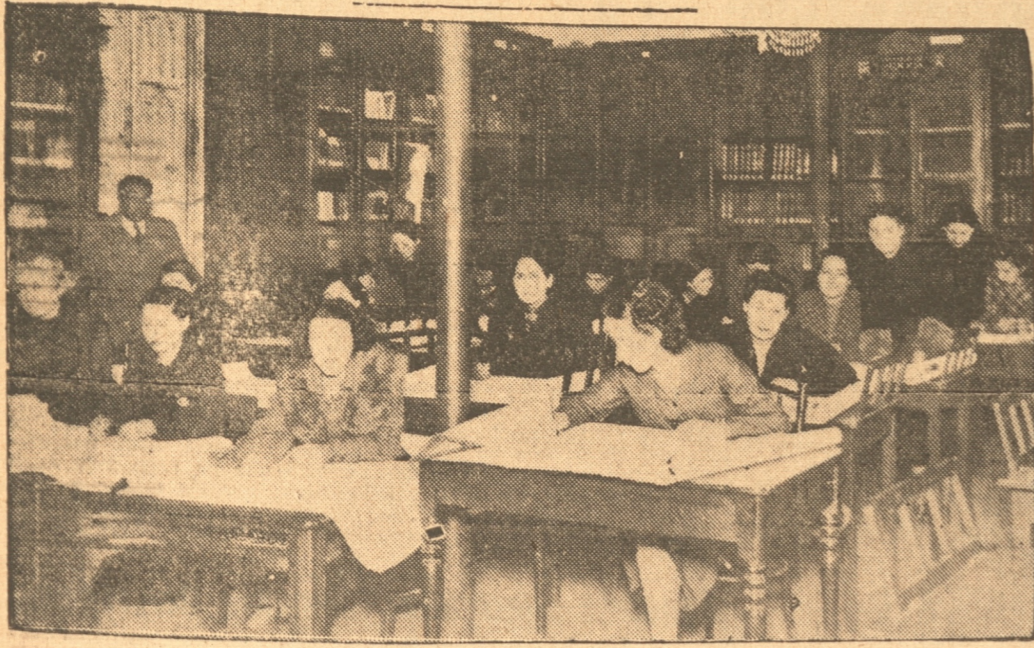
GRUPO DE MAESTRAS DURANTE UNA DE LAS CLASES DEL CURSO

Uno de los más interesantes cursos de perfeccionamiento para los maestros primarios de Concepción es sin duda alguno el que se está realizando en nuestra ciudad por el inspector provincial de Educación señor Eleodoro Espinoza M. Consiste este curso en el aprendizaje de la confección de mapas de la provincia por ahora, luego podrá ser de un área más amplia, con las ca-