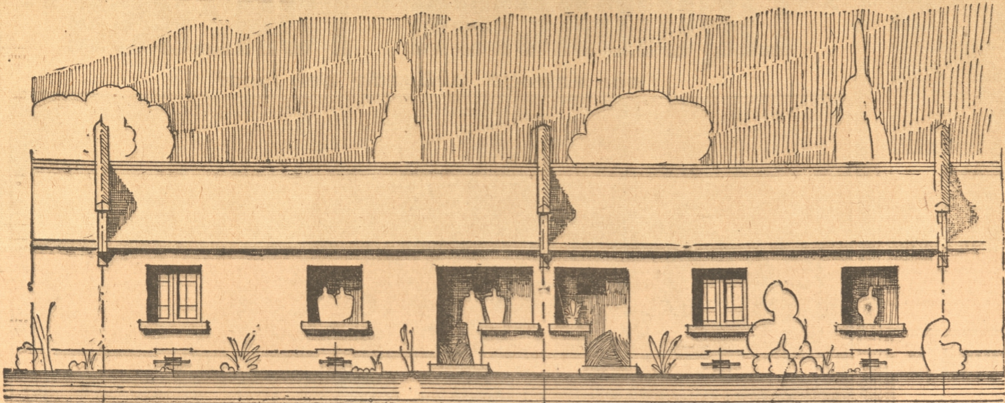
FACHADA PRINCIPAL DE LAS CASAS QUE SERAN CONSTRUIDAS