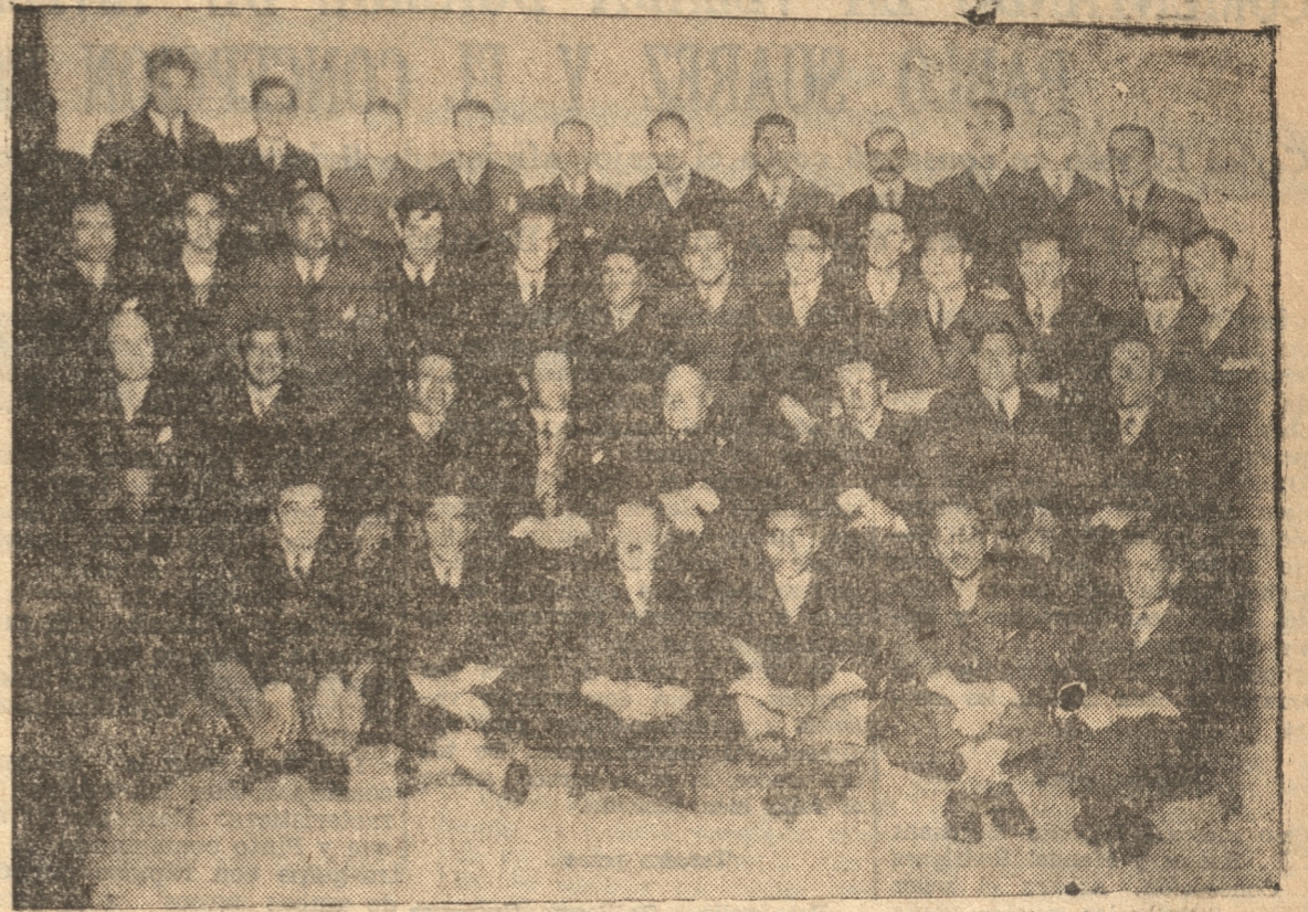
GRUPO GENERAL DE LOS ASISTENTES A LA MANIFESTACION

Como habíamos informado el sábado último a las 20 horas se llevó a efecto en el club social de este pueblo el gran banquete con que el pueblo de Penco celebraba la vuelta a la civilidad de la República.