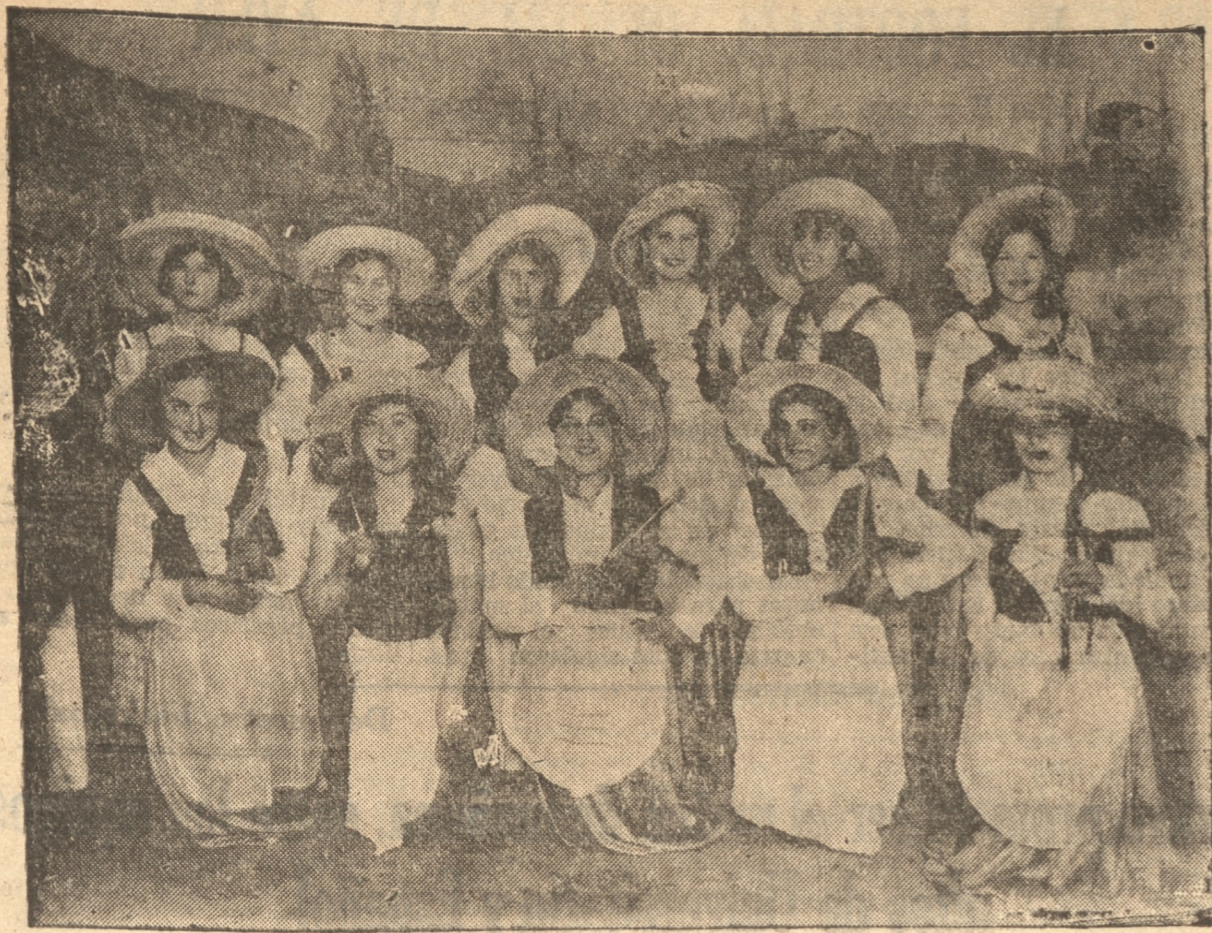
LAS ALUMNAS QUE TOMARON PARTE EN EL NUMERO "LAS SEGADORAS"

Se llevó a efecto con todo éxito en el Teatro Concepción