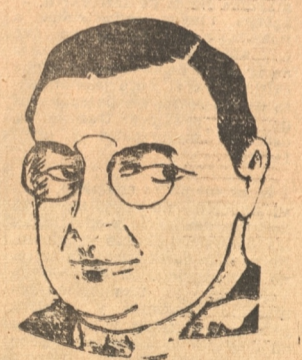
OSMAN PEREZ FREIRE, a quien se rindió homenaje en la capital

Diversos elementos artísticos de la capital efectuaron ayer en la capital una velada en la que se rindió homenaje a la memoria del malogrado compositor nacional Osman Pérez Freire, fallecido hace dos años en España, mien-