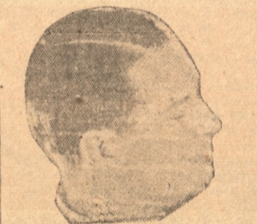
El simpático actor MAURICE CHEVALIER

El Teatro Rialto anuncia para dentro de poco el primer "road-show" de Paramount en el presente año.