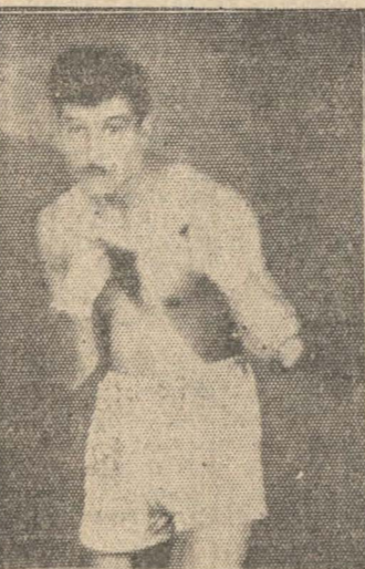
JIMENEZ El crack local

teurs de la Asociación de Santiago, lo que hace que el carnet de peleas sea un programa formidable.