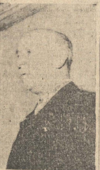
DON MARMADUQUE GROVE, Secretario General del Partido Socialista

yan en jueces de su propia causa y añaden que propician la realización de un Congreso general al cual concurrirán en igualdad de derechos todas las seccionales constituidas. Agregan, además, que ratifican el desconocimiento de las expulsiones de que se les ha hecho objeto, que no son válidas por tener la Federación de la Juventud Socialista autonomía organizativa y reiteran su solidaridad con la actitud asumida por el diputado señor César Godoy.