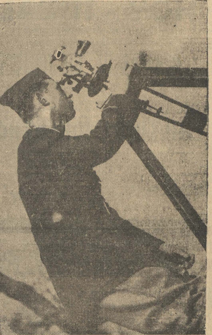
Servicio Topográfico del Ejército. Observación del horizonte con ayuda del teodolito